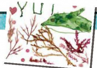
◀海藻おしぼ作品例