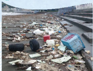
海に流れ着いたごみ