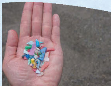
小さいプラごみを生き物が食べてしまう