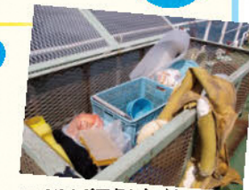
べいくりんが回収したごみ

東京湾を清掃する船でとれたプラスチックごみなどを展示。実物の船やごみを見ながら海の環境について考えよう!