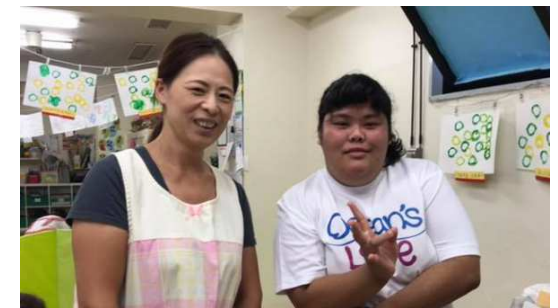
保育園での業務体験