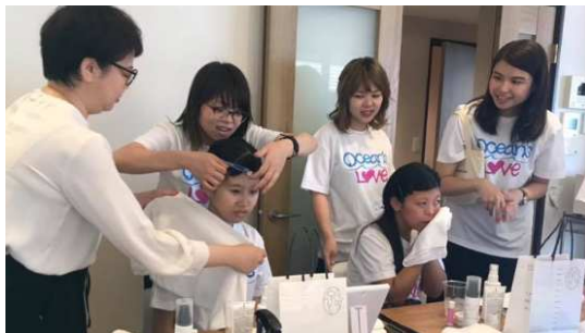
【B by E様】みだしなみ講座