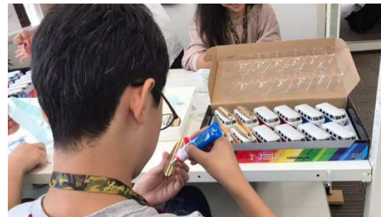
【Local Motion様】本社での業務体験