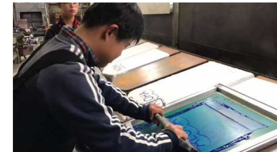
【POB様】Tシャツプリント体験