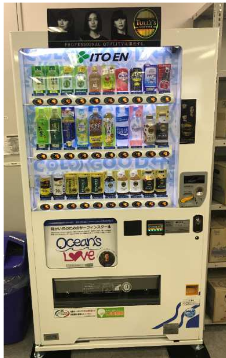
【設置例】 (株)ジェイ・スポーツ様