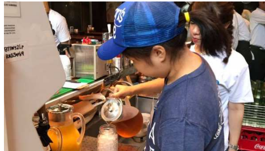
【ゼットン様】店舗での業務体験