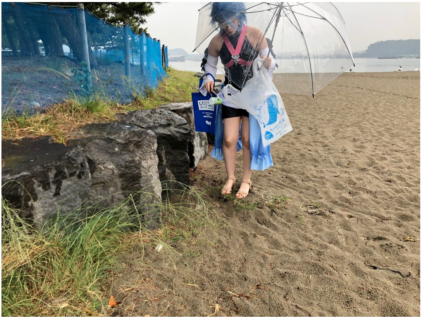
カンやペットが多め 中にはボンドのから筒（コーキング材）も落ちてたり