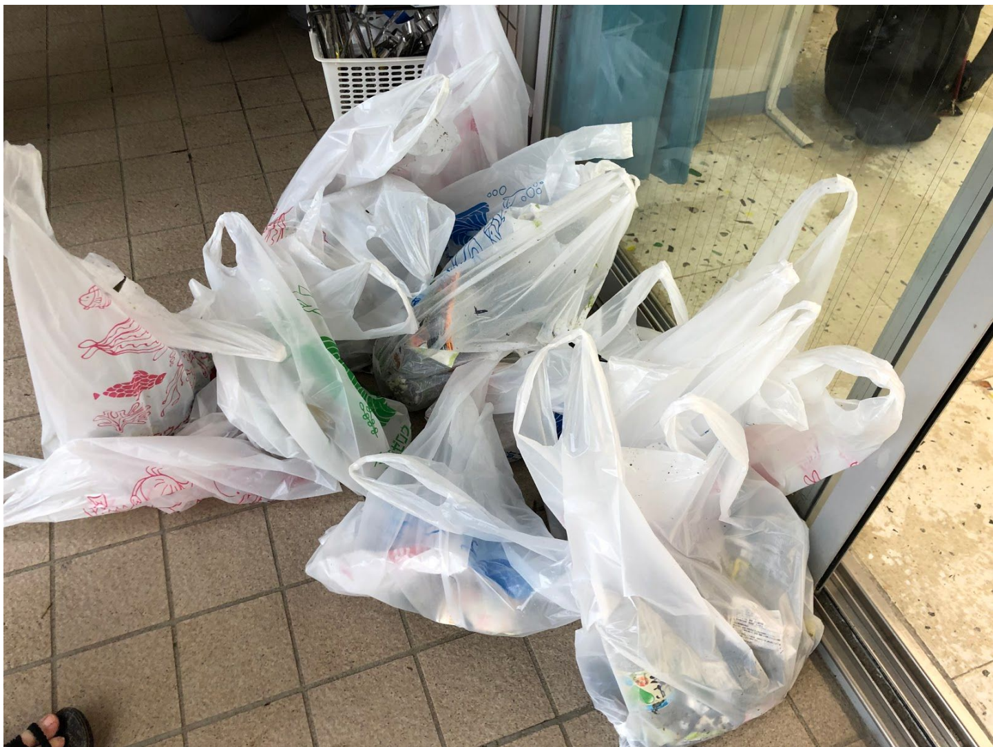
総勢15人、交代しながら1時間半ほどで回収したごみ