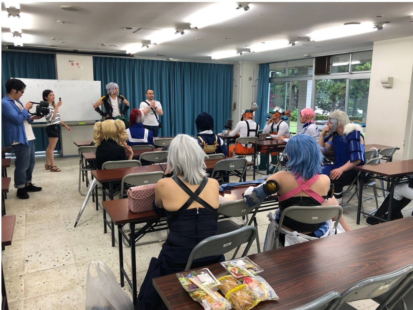
1時間ほどで、横浜の「海の公園」に到着