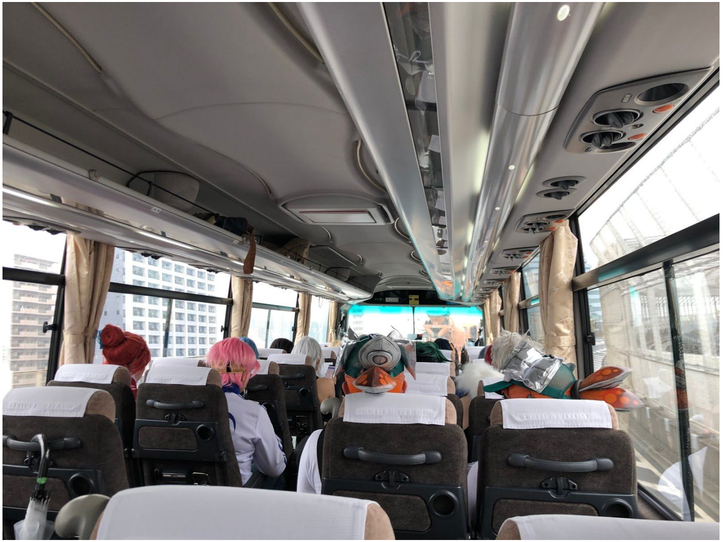
バスで横浜の「海の公園」に移動