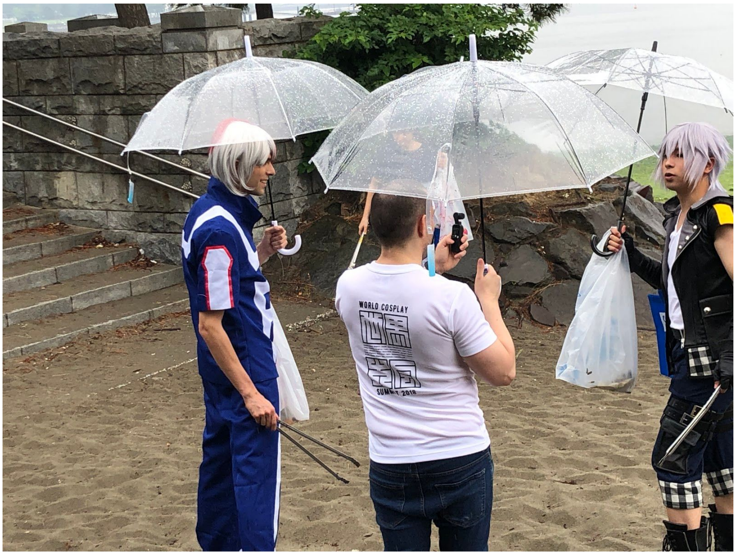
アラムナイにインタビュー