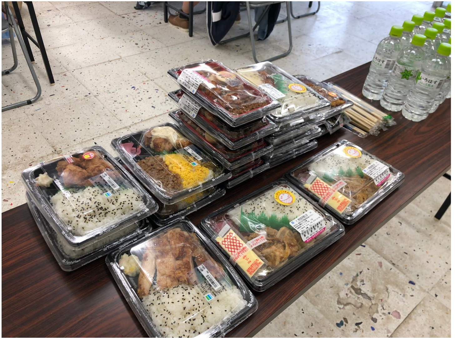
お昼ご飯&このあとの動きの説明