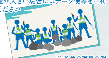
参考 集合写真の例