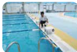
壁にぶつからないように設置する浮き具