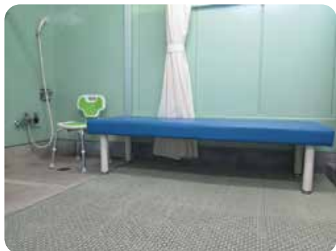
医療用ベッドの設置 45,000円