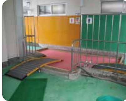
スロープ (1台) 約82,000円