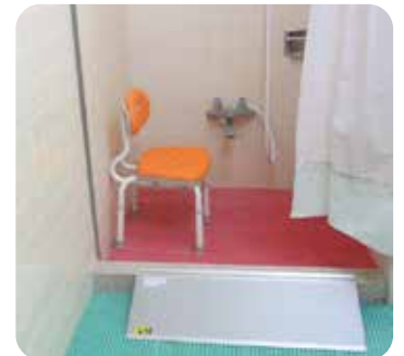
スロープ 約8,000円 シャワーチェア 約10,000円

シャワールームの段差をなくすためにスロープを設置する とともに、シャワー用の椅子を設置しました。