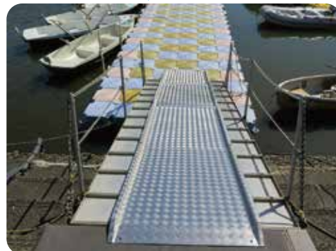
渡り梯子の設置 約500,000円