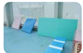
プールサイドに敷いてマットとして使用