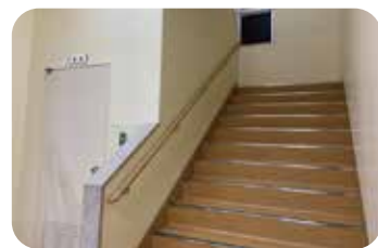
手すり (内側) 約127,000円