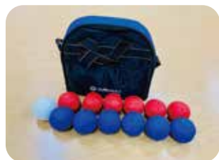
ボッチャ (1 セット) 約 27,000 円