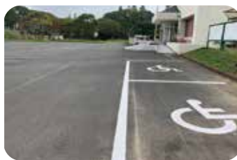
身障者駐車スペース 約70,000円