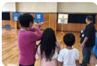
スポーツ吹き矢 (1 セット) 約 25,000 円