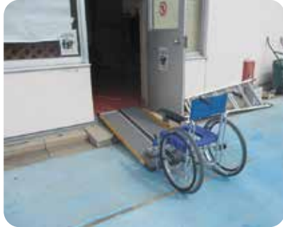
スロープ 約76,000円 車椅子 (1台) 約75,000円

車更衣室からプールに行く途中の段差をなくしてほしい。 また、濡れてもいい車椅子があるとよい。