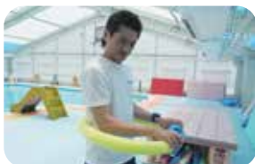
浮き輪のように使用して水中歩行をサポート

今回の備品配備に際して、当事者の声を事前に聞いてくれたのが良かった。 パラスポーツ器材は既存のもので十分！ ※下記は参考として紹介