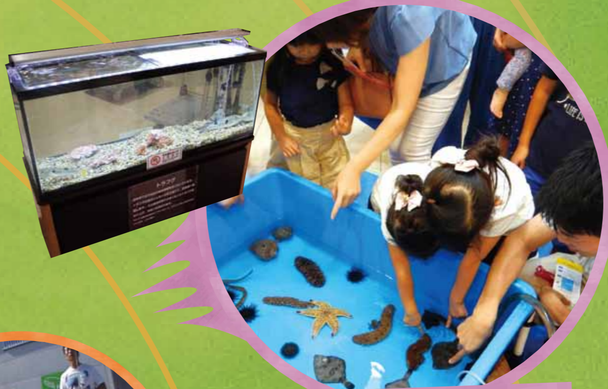
お魚タッチプール & 展示ブース