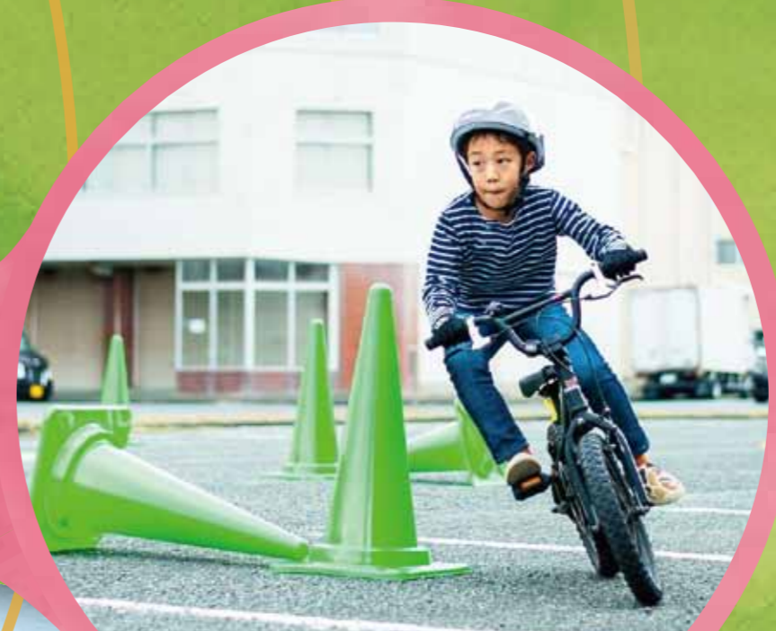
サイクルジムカーナ体験