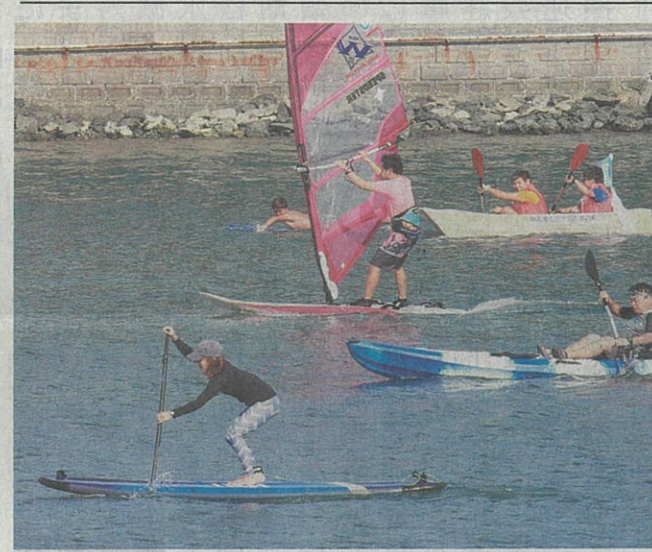
ボートレース浜名湖(湖西市新居町)で一日、ウインドサーフィンの練習風景

川勝平太知事は、災害時の外国人への対応に「全ての言語をカバーするのは難しい。外国人にも分かりやすい簡単な言葉を使うなどの心掛けが必要だ」と講評した。