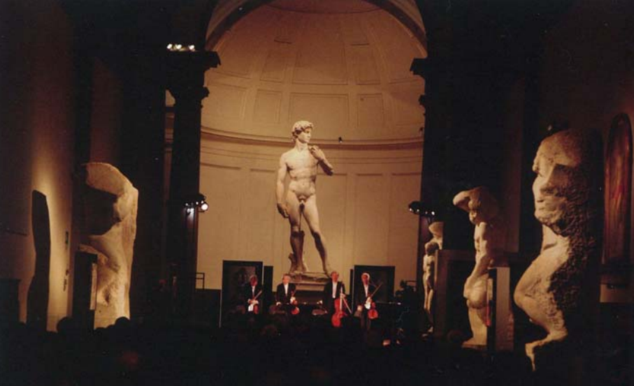
Photo: Galleria dell'Accademia Florence Italy ©Gianluca Moggi / New Press Photo Live Recording: Helmut-List-Halle Graz Austria Recorded by ORF STEIERMARK