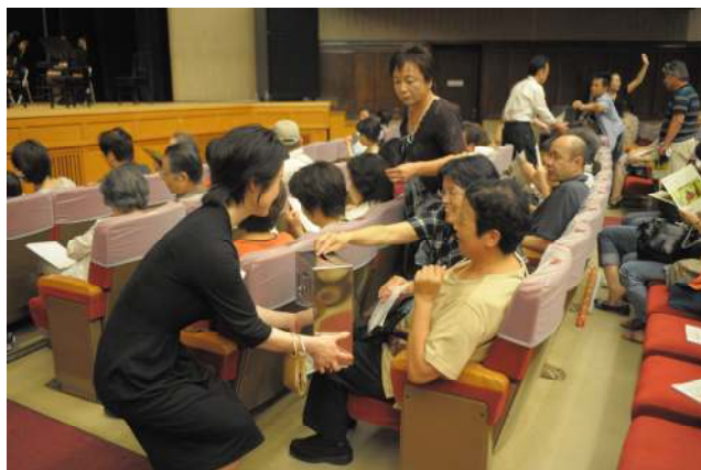
会場内募金（休憩時）