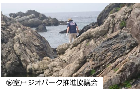
⑯室戸ジオパーク推進協議会