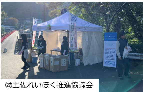
⑦土佐いほく推進協議会