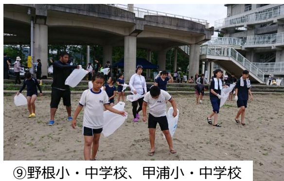
⑨野根小・中学校、甲浦小・中学校