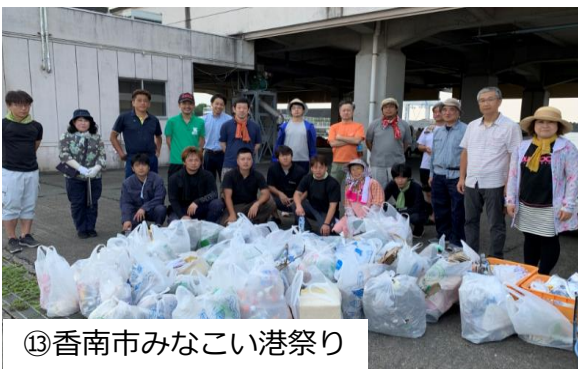
⑬ 香南市みなこい港祭り