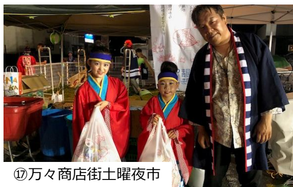
⑰ 万々商店街土曜夜市