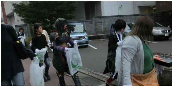
②まんさい こうちまんがフェスティバル実行委員会