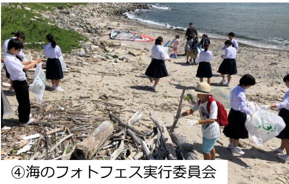
④海のフォトフェス実行委員会