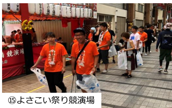
⑮よさこい祭り競演場