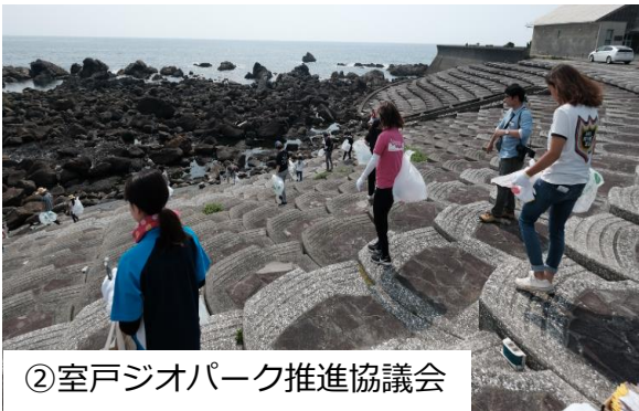
②室戸ジオパーク推進協議会