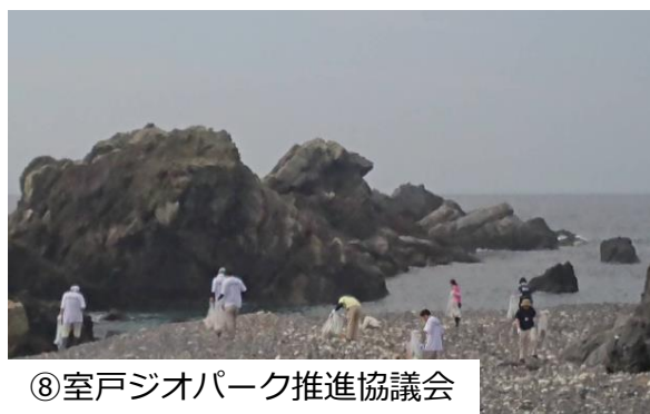
⑧室戸ジオパーク推進協議会