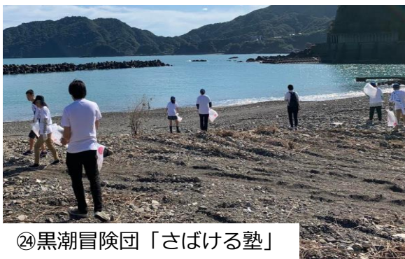
②④黒潮冒険団「さばける塾」