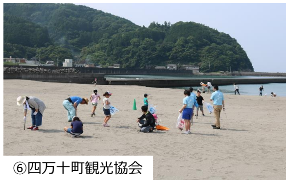
⑥四万十町観光協会