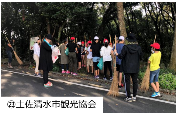
②③土佐清水市観光協会