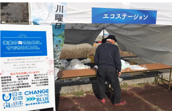
⑧高知県自然・体験型観光 キャンペーン実行委員会事務局