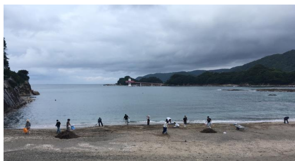
⑭ゲストハウスどうぶつすどまりBOX