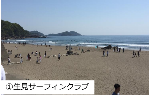
①生見サーフィングクラブ