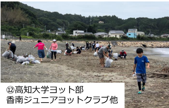
⑫ 高知大学ヨット部 香南ジュニアヨットクラブ他