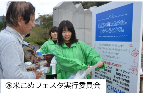
⑥米こめフェスタ実行委員会