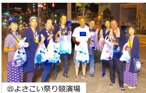
⑮よさこい祭り競演場