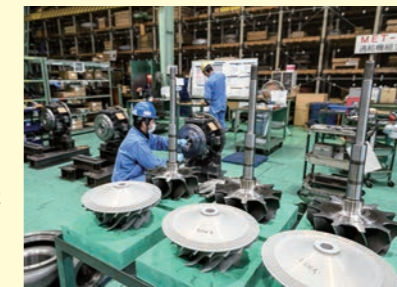
羽根車などの過給機関連部品

船用の過給機や発電所向けのタービンを中心に、船や発電所を動かす機械の部品を製造します。過給機は、エンジンに送り込む空気を圧縮する装置。人間で例えるなら“心臓”と言っていいでしょう。その部品をつくる大事な“脇役”として、日本の陸・海運業を支える仕事です。溶接や機械加工、組立など、意欲があればいろんな技術を身につけられます。