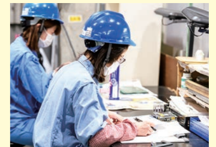
女性社員も活躍している