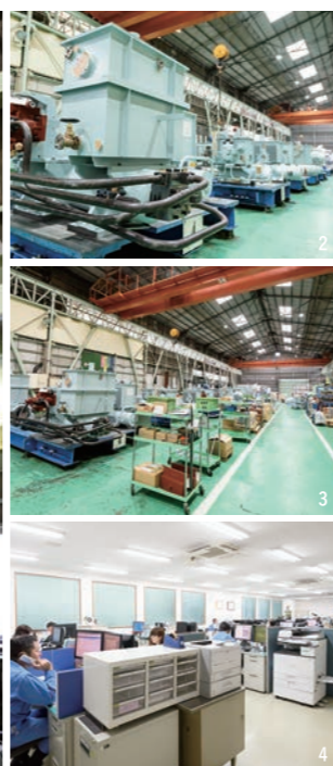
1.指定された形に整える機械加工も重要な仕事で、こうした部品を組み合わせて大きな装置をつくっていく。 2,3.「舵取機」も船の安全航行に欠かせない。年間約200機を製造する主力機械の1つ。 4.設計や管理部などには女性社員も多く在籍する。