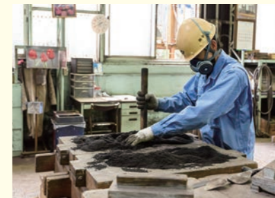
砂から立体的な部品をつかっていく

船の過給機や舵取機、発電所のタービンなど、動力を生み出すのに必要な機械部品の製造です。ユニークなのは、「鑄造」と呼ばれる伝統的な製造方法。現在は長崎県で数社、諫早市では峯陽しか行っていない貴重なつくり方です。身近な鑄物ではマンホールや仏像、岩手県の南部鉄器でも有名。世界に誇る日本の技術を受け継ぎ、未来へつなぐ大事な仕事です。