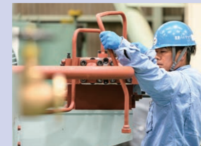
最終段階の組立作業

船や発電所で使われる機械を製造する仕事です。設計から資材調達、溶接、機械加工、組立などまで、モノづくりの「1から10まで」“最初から最後まで”すべての作業に携わることができます。つくった機械は船や発電所の一部となって、世界各国に生活物資を輸送したり、一般家庭に電気を送ります。見えないところで、多くの人々の生活を支えているのです。