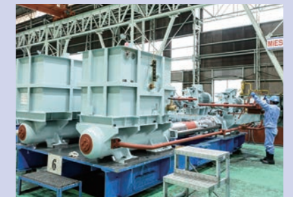
船用の主力製品「舵取（かじとり）機」