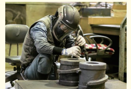
形を滑らかに整える仕上げ作業