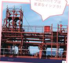
船上のパイプは重要なインフラ!