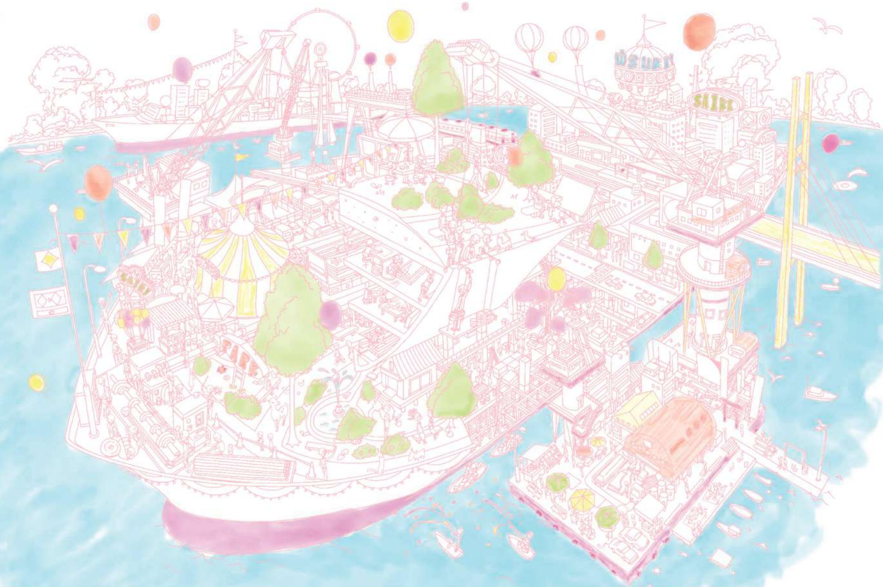
イラスト / スヤマンガ

造船所は大きな家族のような場所でした。そこで働く女性たちがどんな仕事をしているか、どんな生活をしているのか、次ページからご覧ください。