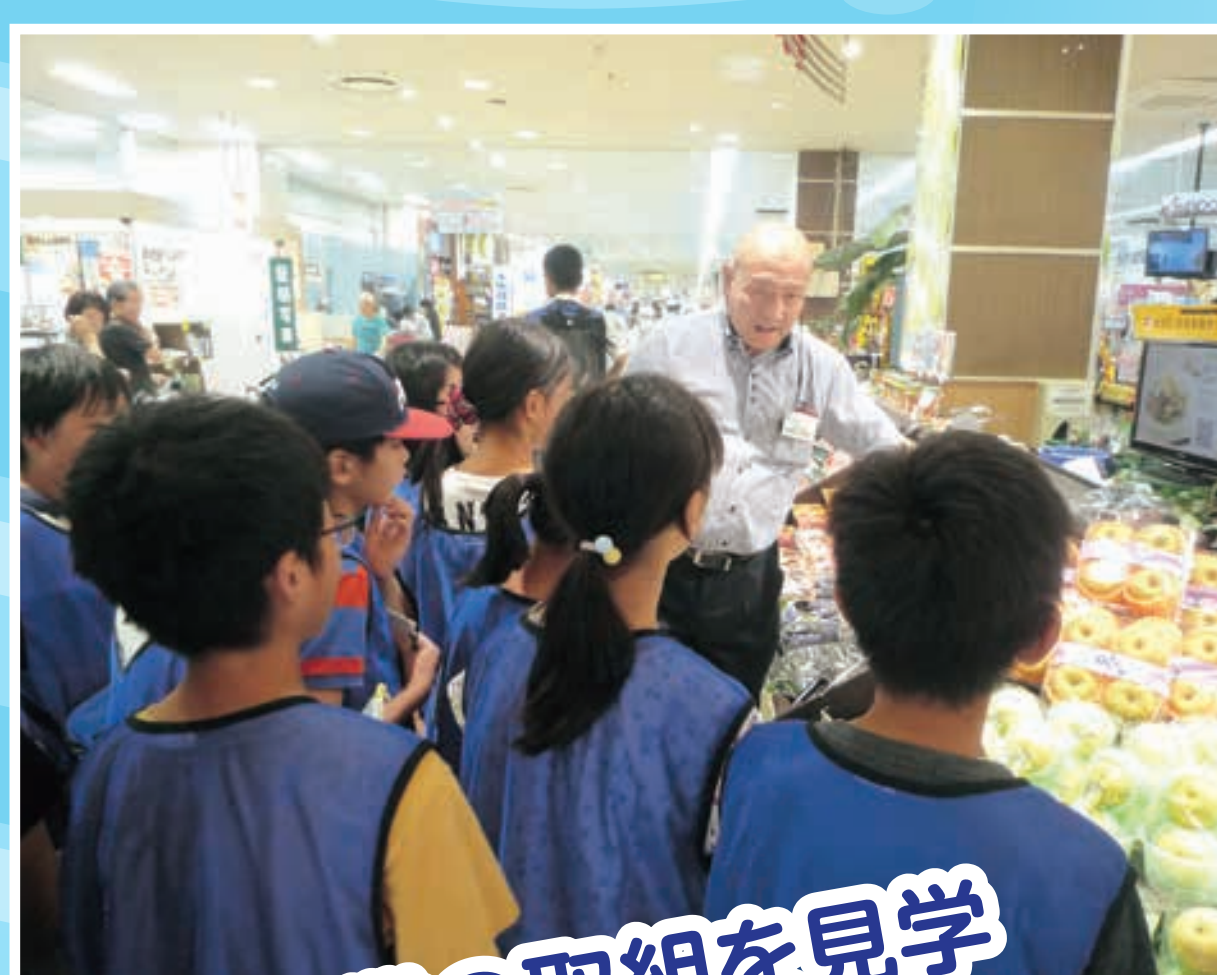
企業の取組を見学