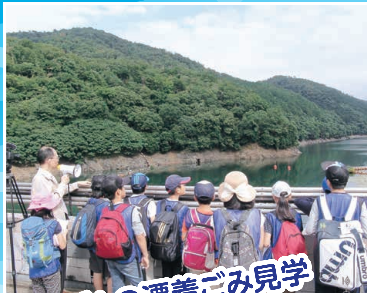
ダムの漂着ごみ見学