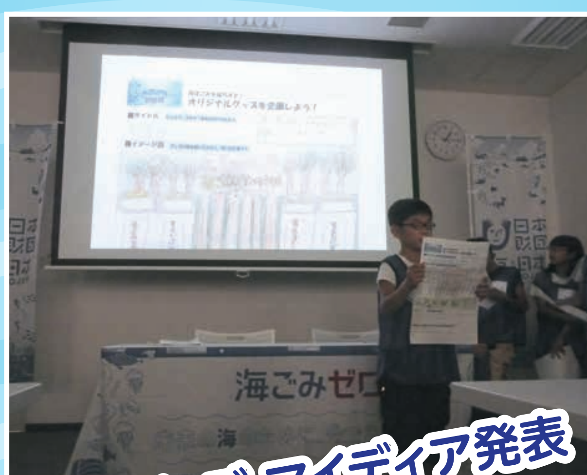
対策グッズ アイデア発表