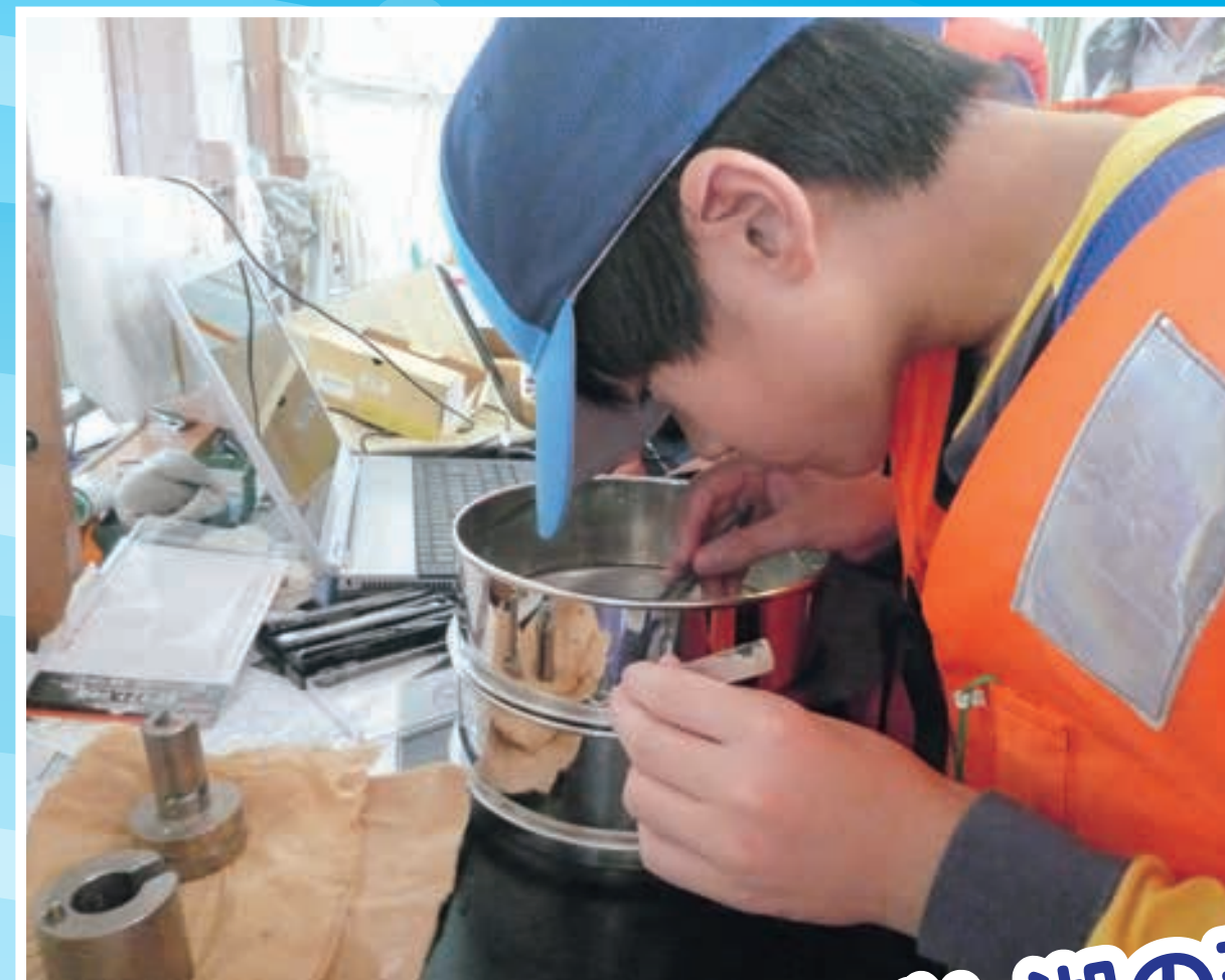
びわ湖の現状を調査