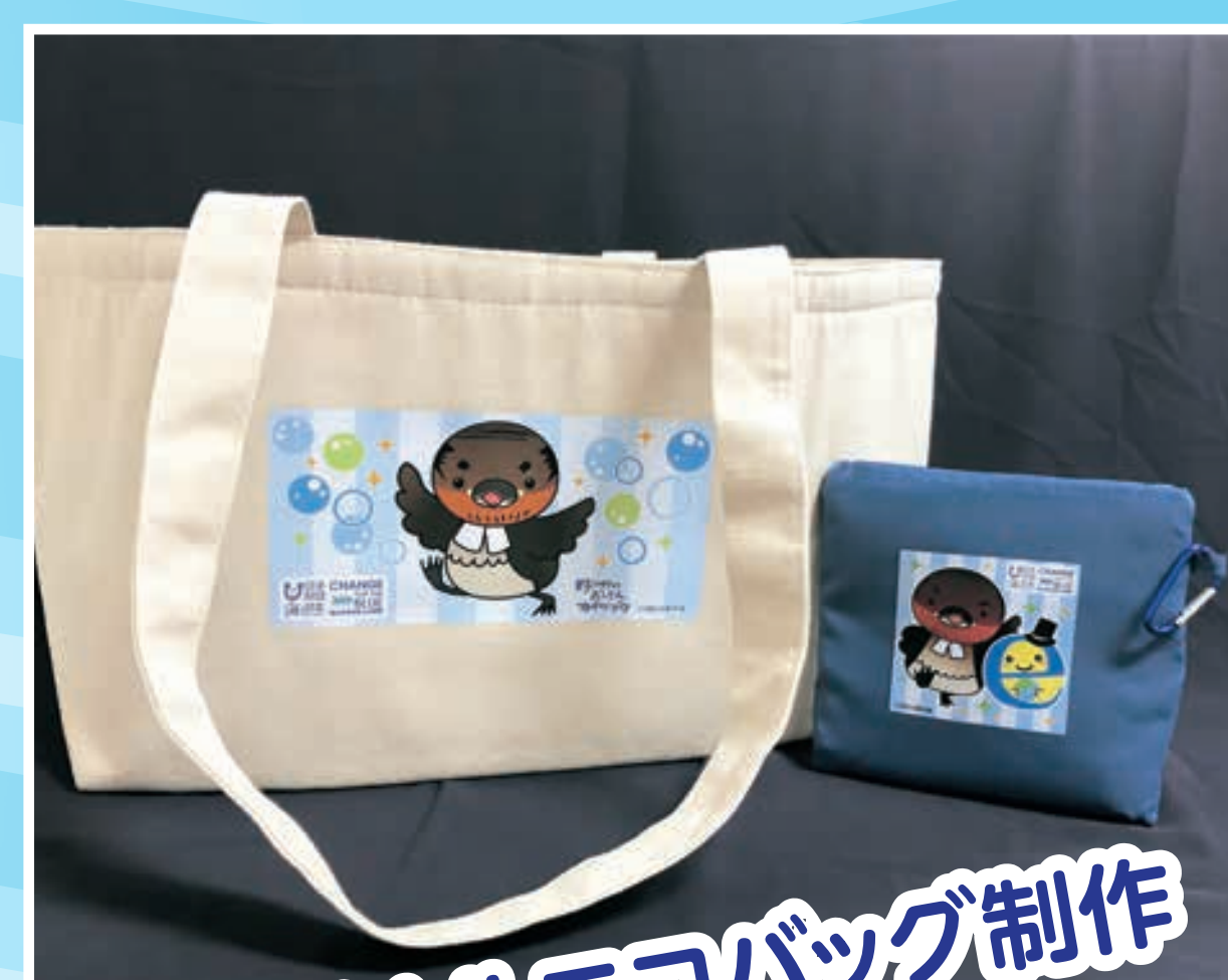
オリジナルエコバッグ制作