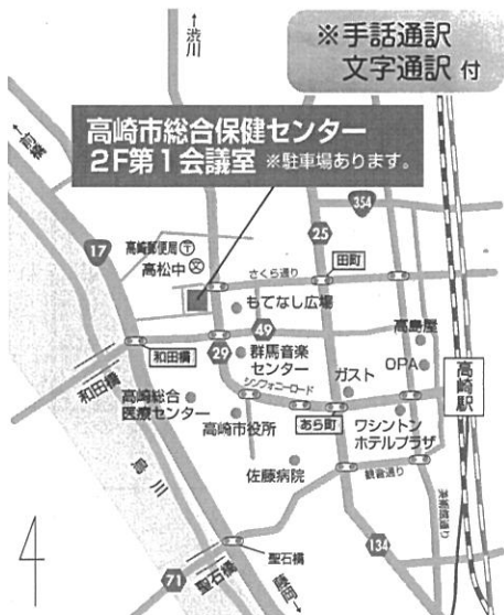
JR高崎駅西口から徒歩13分