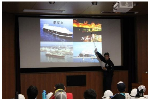
午後は日本海エル・エヌ・ジーへ