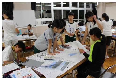
夕食後はグループワークを実施