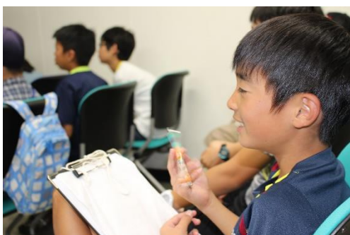
日本海の水産資源について学びました