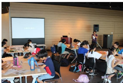
まずは信濃川について学びました