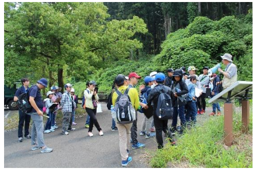
まずは新津丘陵の地層見学へ