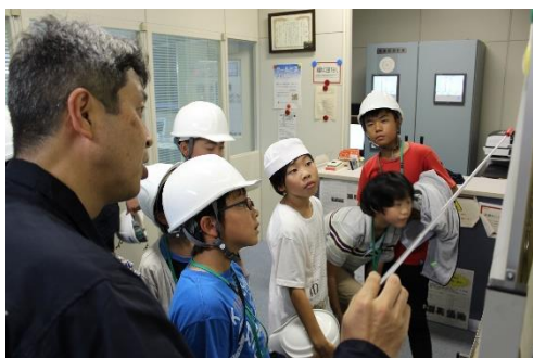
LNG基地の役割を教わりました