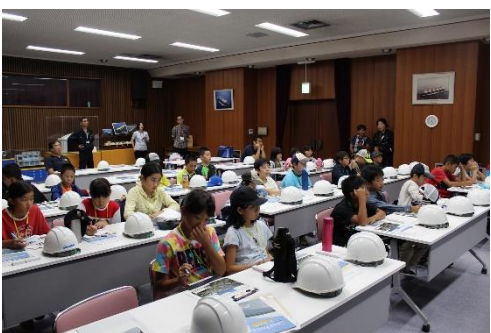
海を渡ってくるエネルギーを勉強