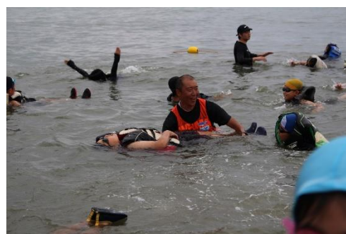
ライフジャケット講習、水上バイク体験を実施