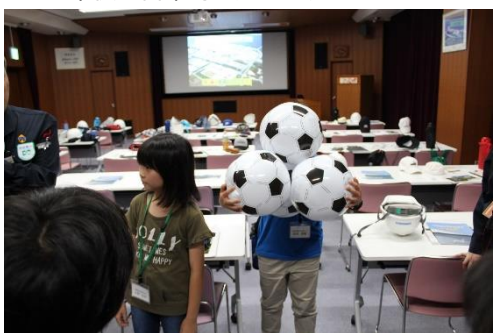
LNGの体積の変化を学びました