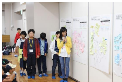
みんなで協力して発表しました