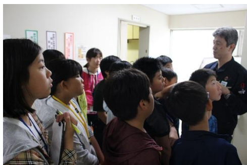
海から来るエネルギーについて知りました