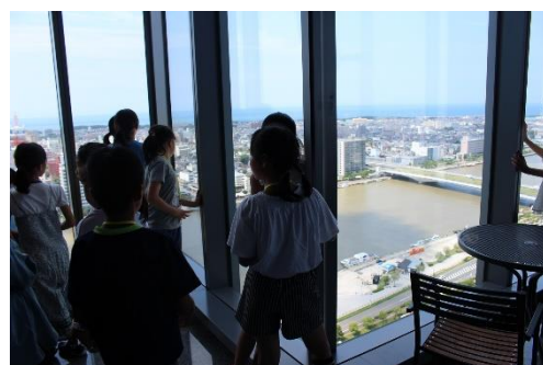
みんなの住む町と川の大きさは違うかな