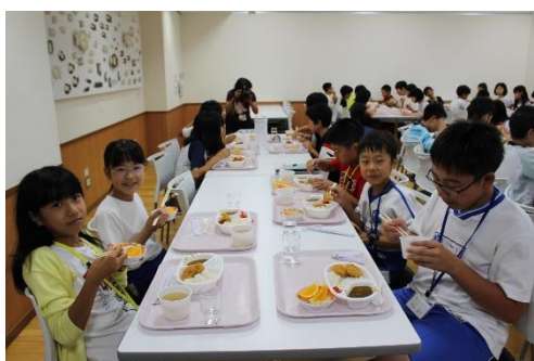
宿舎に帰ってみんなで夕ご飯