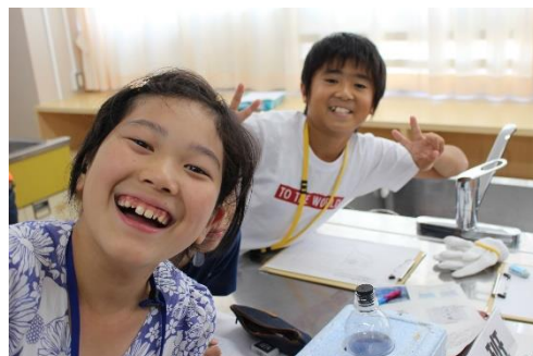
うまくできたかな