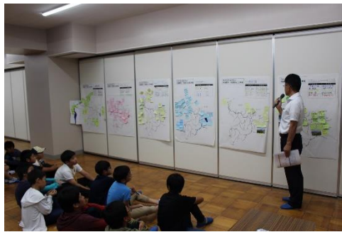
とてもいい発表ばかりでした