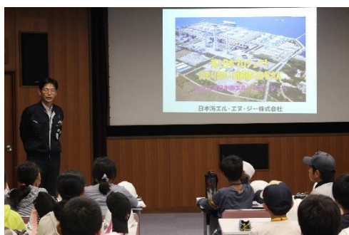
翌朝はLNG基地の見学会