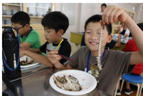
上手に食べられるようになりました！