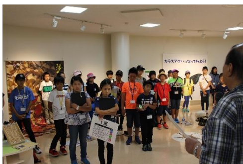
新潟市秋葉区にみんな集まりました