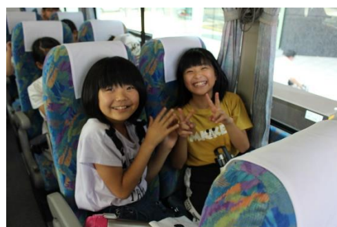
2日間でみんな仲良しになりました！