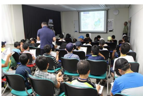
続いて日本海区水産研究所へ