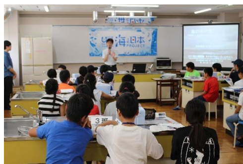
宿舎へ移動して今度は実験の時間