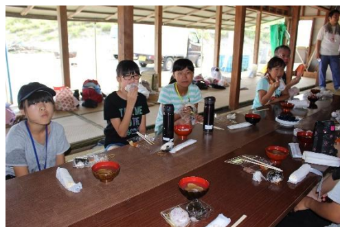
とれた魚はさっそく調理していただきました