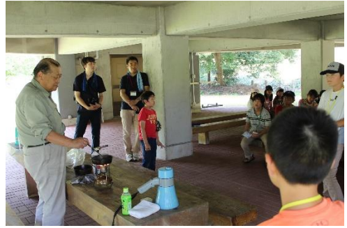
原油のしみ込んだ砂を燃やす実験