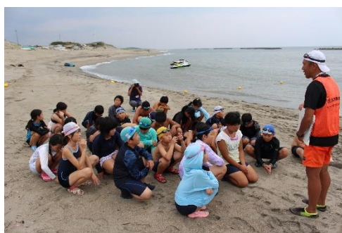
そしてお楽しみ的大海へ！