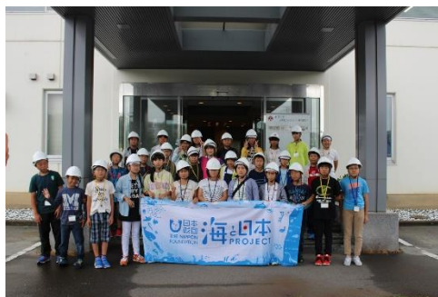
全員での集合写真