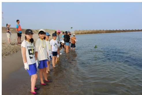
2日目は早朝から海へ移動