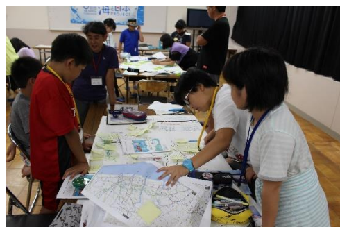
みんなのまちや川についてまとめました