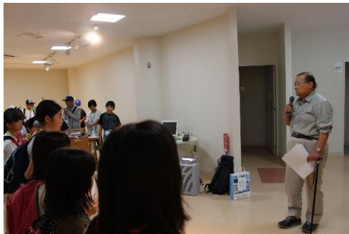
新潟と福島の子どもたちが集合