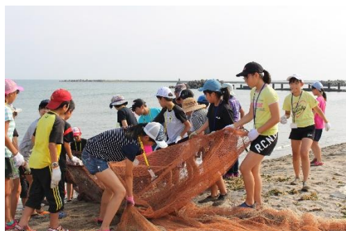
みんなで引っ張り上げて、魚はいるかな？