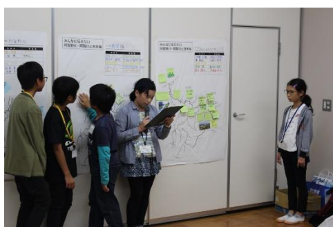
新潟と福島はどんな違いがあるかな