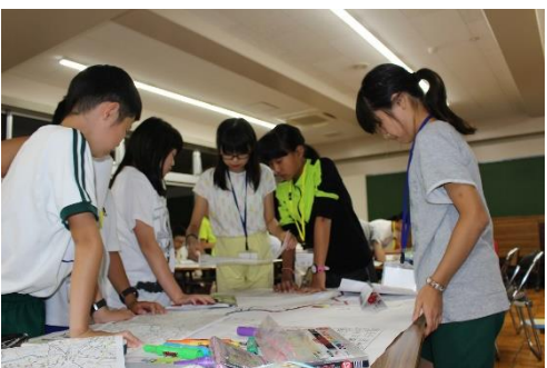
自分の住むまちや川についてまとめました