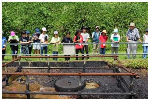
原由が地面から湧いていたんだね