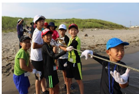
快晴のもと、地引網体験を行いました