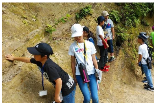
この地層はいつできたんだろう？