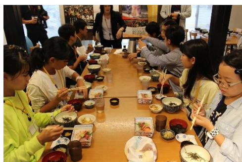
昼食は新潟市内の食堂で海鮮丼！