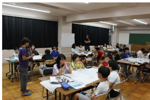
夕飯を食べて最後にグループワーク