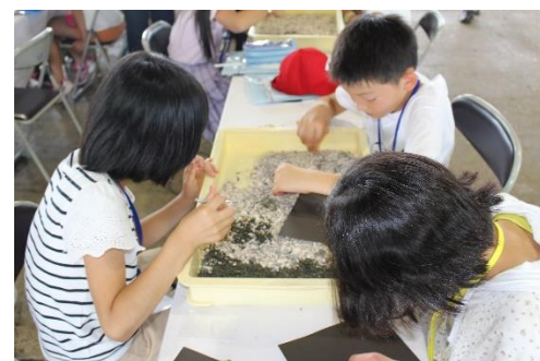
貝殻を使ったワークショップも体験