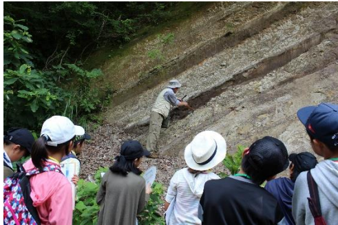
色の濃いところから原油が染み出ています