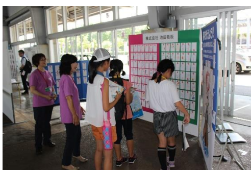
新潟西港に移動し、海や港の展示を見学