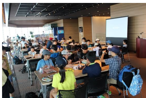
新潟市・メディアシップ20階に集合