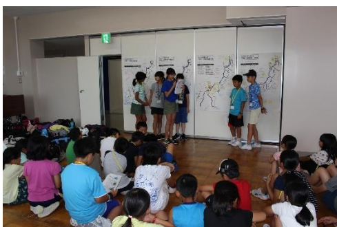
最後はグループワークの内容を発表