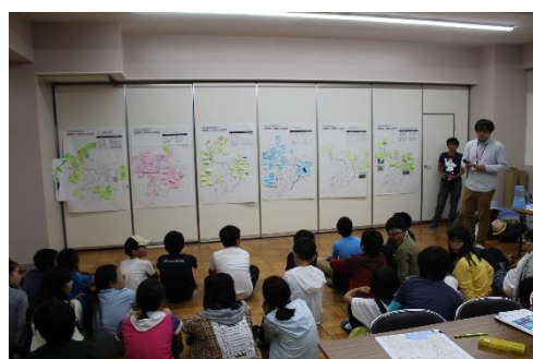
宿舎に戻ってまとめの発表会