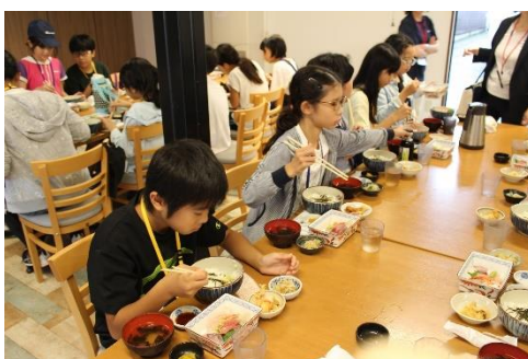
お魚好きになってくれたかな？