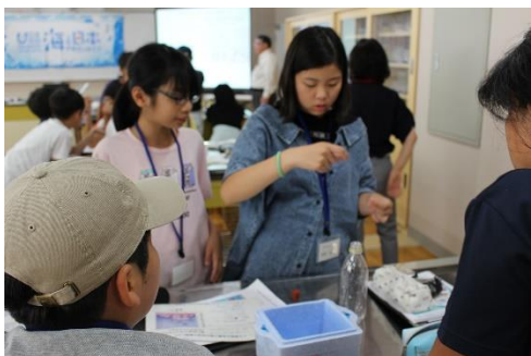
雪の結晶ができる仕組みを学びました