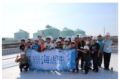
最後はみんなで記念撮影