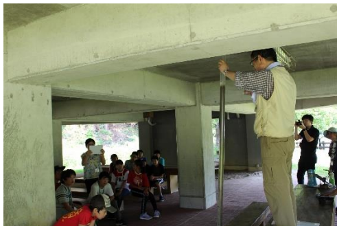
地層がどうやってできるかも学びました