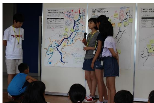
新潟と長野のまぢや川のことを教えあいました