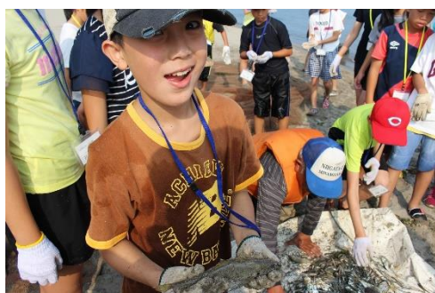
やったー、魚がとれました