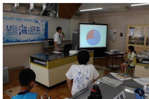
帰ってお魚マスターのお魚食べ方講座