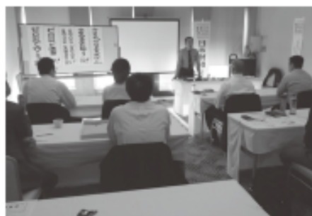
座学研修プログラム