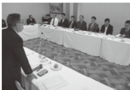
年に2回、受講者が一同に会する ミーティングを開催