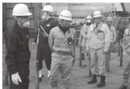
安全衛生アドバイザー相談会に随行 (実地研修)