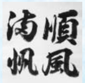
森田さんの直筆です

たくさんのお話ありがとうございました。これからもますますお元気で地域のアイドルでいてください。