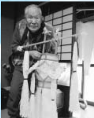
灯籠も手作りですよ！

昨年は99歳（白寿）ということで、親族が集まりお祝いをされたとかで、寄せ書きも見せていただきました。その中に麻雀をしている姿を発見！「麻雀の仕方を教えておくれと言うから、教えてあげた。」そうです。