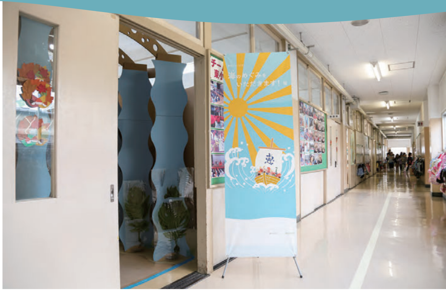
いつもの教室が、ある日突然ミュージアムに