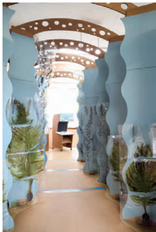
本物の海藻でできた、海藻トンネルを抜けたら始まりです