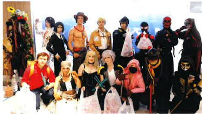
世界コスプレサミットでゴミ拾いに参加したコスプレイヤーたち

海と日本プロジェクト in みやざきでは、日本財団などが展開している『コスプレ de 海ごみゼロ』を、宮崎市青島で開催することになりました。コスプレイヤーと連携した海洋ごみ対策活動を実施することで、コスプレイヤーが有する発信力や影響力で海洋ごみ問題を広く周知し、削減活動を促す世界的ムーブメントを起こす共同で事業に取り組みたいと思います。