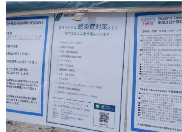
神奈川県 感染予防対策取組書