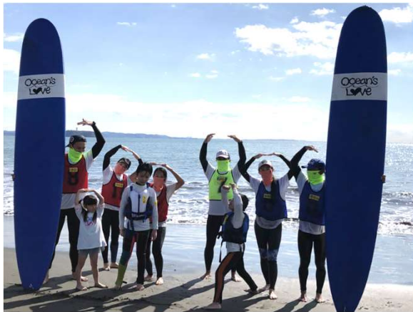
少人数に規模縮小 神奈川県民のみ