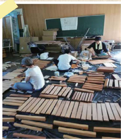
木が腐らないように自然由来の 塗料を染み込ませます。