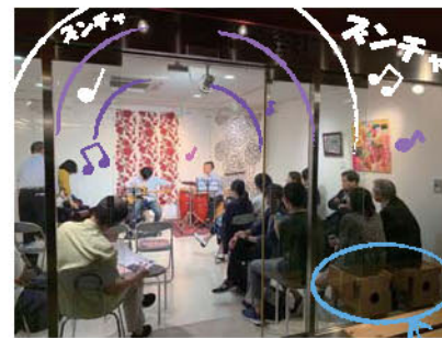
ライブの様子と客席のつながっき

ライブ後にはカホンつながっきを叩いてもらったり、カホンの扱い方についてアドバイスを頂いたり、有意義な時間を過ごすことができました。