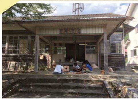
元小学校の求祐館で作業を行います。

9月9日から15日まで6日間行いました。 全体的に参加人数が少なく予定通りにいかないことも多々ありましたが 試作の経験を活かし全員で分担して作業を行うことができました！