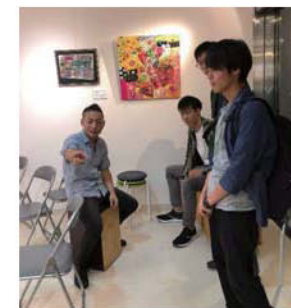
楽器についてのお話を聞く