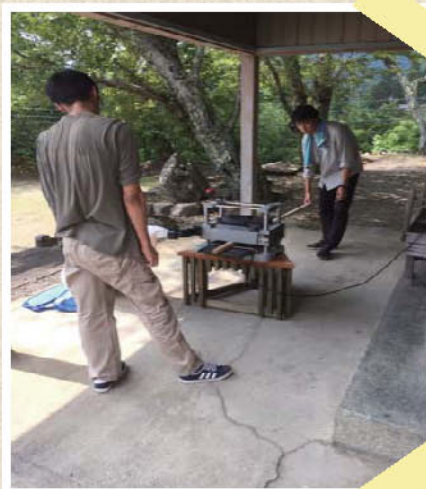
自動カンナをフル活用して 面材から作りました！