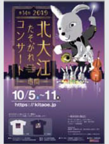
↑イベントポスター

楽器の街、北大江地域で行われる音楽イベント。1週間にわたって、野外会場や、地域内の各会場にて様々な音楽が繰り広げられます。今年の制作物が楽器をテーマにしていたことから、イベントでカホンつながっきを活用して頂けることになりました。