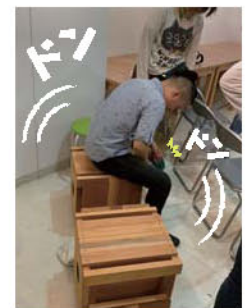
つながっきを叩く様子