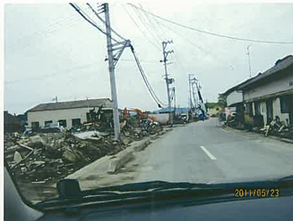
被災したお寺。ブルーシートの部分は壁がない

右の写真は、津波でさらわれた車両に貼ってあった告知文である。市が調査し、いつからここから撤去する作業を始めるか記してある。予定では3月28日からとなっていたが、手が回らないようだ。