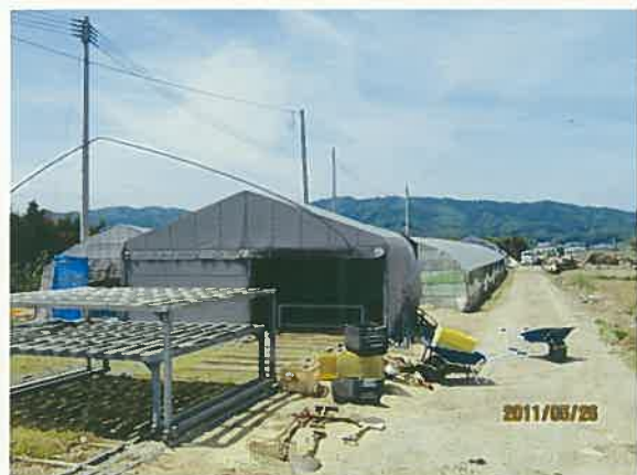
ヘドロ除去、清掃後のイチゴ苗ポットの収納庫