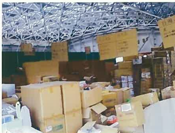
九州からお米が届けられている。