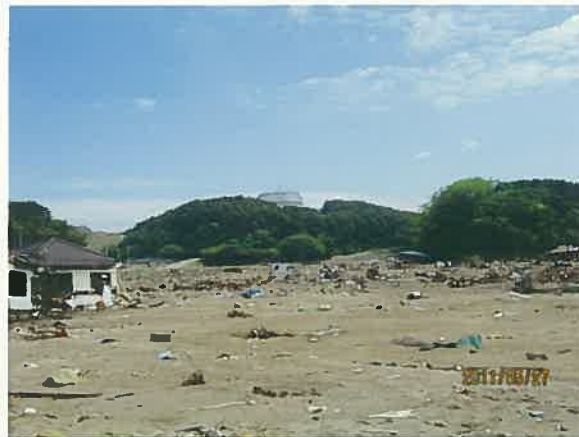
支援宅から少し降りて港を望む