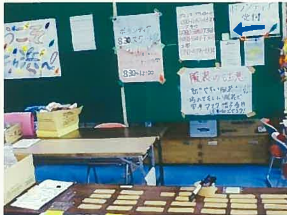
待機スペース（裏側が支援物資の保管場所）