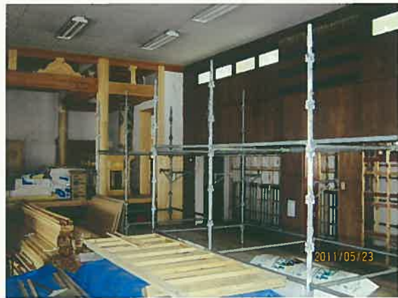
右壁のうっすらと色の違うところまでヘドロ

震災後、避難所と親戚宅などに別れて暮らしている家族も多いそうで、津波のことを考えれば「ここにはもう誰住まないだろう」というも決して大げさじゃないと思う。