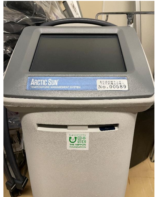
(5) 体温管理システム 1台