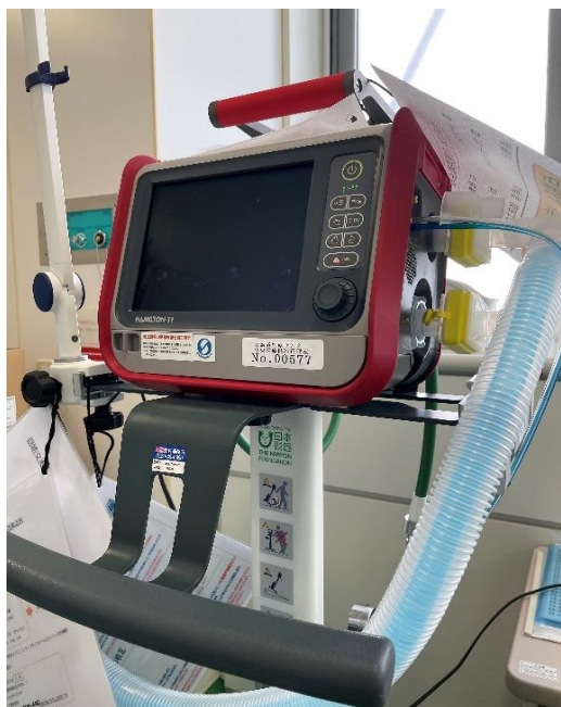
(1) 搬送用人工呼吸器 2台