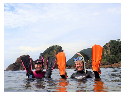
天草海部のスタッフたち

安全とともに語りつぐ人が増えることを目指して活動しています。天草海部と一緒に、活動しませんか？