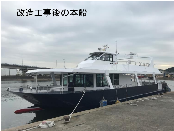
改造工事後の本船