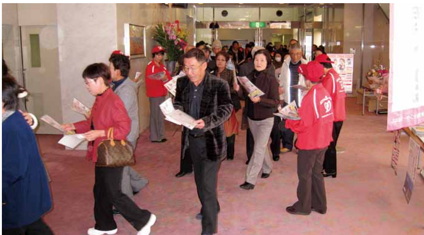
東京エレクトロン韮崎文化ホールでPR

また、11月23日、東京エレクトロン韮崎文化ホールで開かれた山梨県警察本部主催の「山梨県警察音楽隊第4回ふれあいコンサート」でも、エントランスにて資料を配付、観客に被害者支援活動の重要性を訴えました。