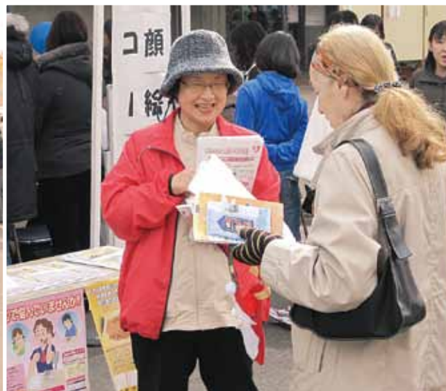
小瀬スポーツ公園の県民の日記念行事にて

当センターでは、11月13日、14日に甲府市・小瀬スポーツ公園で開かれた「県民の日記念行事」に、山梨県警の協力を得て、被害者支援活動の広報・啓発活動を実施しました。陸上競技場前の「ふれあいけいさつコーナー」で、当センターのボランティア支援員ら約20人がそろいの赤いウインドブレーカーに身を包み、来場者にチラシなどを手渡し、PRしまし