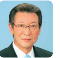
周防大島町長 椎木 巧

周防大島町B&G海洋センタートイレ、シャワー、更衣室のリニューアル(新築)事業にあたりまして、多額の助成金を賜り厚くお礼申し上げます。今回の改修により衛生的で利便性の高い施設に生まれ変わり、町内の子供たちの利用はもとより県外からの体験型修学旅行生の利用も増加し、本町が目標としている観光交流人口100万人をめざす「賑わいの創出」にも大きな役割を果たすものと期待しております。今後とも青少年の健全育成と海洋スポーツ、レクリエーションの普及に努めてまいりますのでご支援のほどよろしくお願い申し上げます。