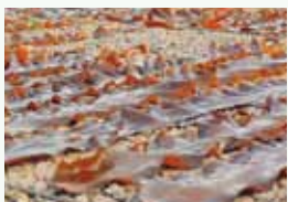
①コンブ干し体験 みんなで力を合わせて干します。干すことで旨味成分アップ!