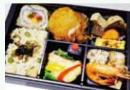
③おいしい海藻弁当 人気和食店「寿々半」の豪華お弁当をご用意