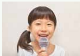
②YouTuber体験 カメラに向かって、北海道産アオノリの良さをレポート!