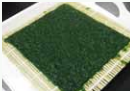
①板海苔づくり体験 北海道産アオノリを刻んで、昔ながらの手法で板海苔を作ります