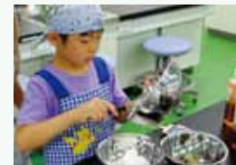
②海藻料理体験 いろんな種類の海藻を使って料理! みんなでお昼にいただきます