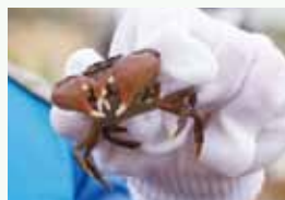
②磯探検 海藻や、カニ、ヤドカリなどの海の生き物を探してみましょう