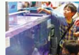
③水族館飼育員体験 魚へのエサやりや、水質チェックなど飼育員さんのお仕事をしてみよう