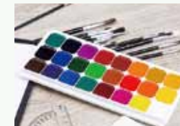
④ガゴメコンブお絵かき 絵のコツをデザイナーさんが指導。優秀作品は今秋発売の商品に採用!