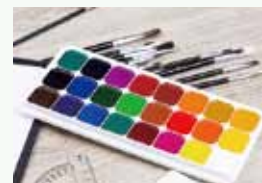
④コンブお絵かき 絵のコツをデザイナーさんが指導。優秀作品は今秋発売の商品に採用!