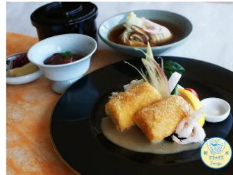
白海老豆乳クリームコロッケ定食

所在地 射水市善光寺18番4号 TEL 0766-82-4111 営業時間 11:30~14:00 (L.O 13:30) 定休日 無休