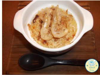
白えびのスcoopクリームコロッケ

所在地 射水市八塚225-1 TEL 0766-52-0225 営業時間 11:30~14:00 (L.O) 17:00~21:00 (L.O) 定休日 木曜日