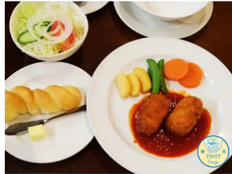
シロエビスククリームコロッケセット

所在地 射水市松木719 TEL 0766-84-8595 営業時間 11:30~14:00 17:00~20:00 (L.O 19:30) 定休日 月曜日・金曜日