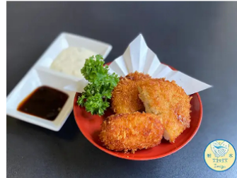
しろえびコロッケ

所在地 射水市北野1555-4 TEL 0766-54-6813 営業時間 11:30~14:00 17:00~22:30 定休日 第1・3水曜日