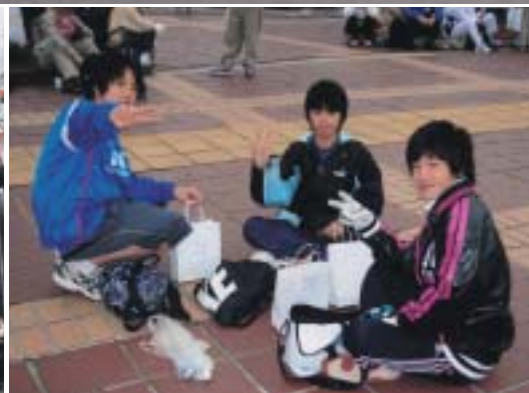
少女少女の部入賞者