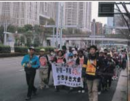
新宿中央公園水の広場を出発