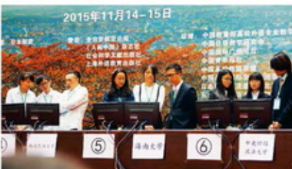
2015年全国大赛总决赛（吉林大学）