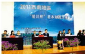
2011西南地区大赛总决赛（贵州大学）