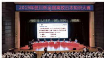
2019年全国大赛个人决赛（北京大学）