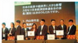
2016年全国大赛总决赛（武汉大学）