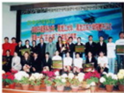
2004年东北亚大赛颁奖典礼（黑龙江东方学院）