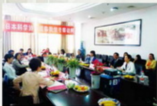
中南财经政法大学 (2014年)