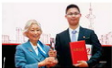
2017年全国大赛，日本科学协会大奖赛颁奖礼（左） 为获奖个人颁发每队的队长荣誉证书（上海交通大学）