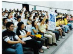
2006年东北地区大赛赛场（宁波大学）