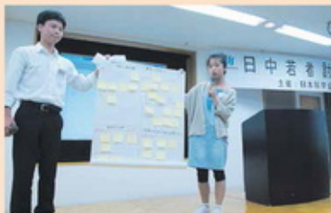
中日青年论坛会 (2013年)