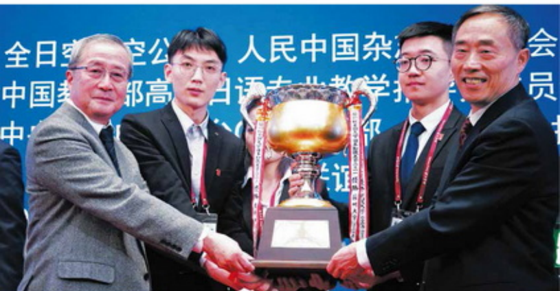
2018年全国大赛，日本财团副会长武彦雄（左）向北京大学党委书记陆鹰（右）向对外经贸大学授予“最佳组织”奖杯（北京大学）