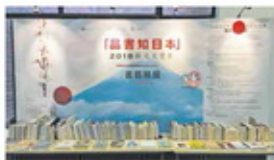
品香知日本（香港理工大学图书馆）