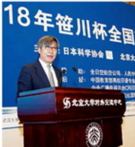
2018年全国大赛，北京大学笹川杯颁奖礼（北京大学）