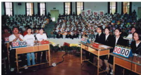
2004黑龙江赛区赛场（黑龙江东方学院）