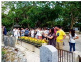
姬百合和平祈念资料馆 (2011年)