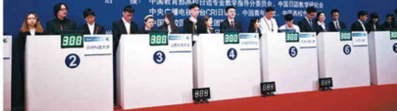
2018年全国大赛团体决赛（北京大学）

赞助：全日空航空公司、人民中国杂志社、社会科学文献出版社 后援：中国教育部高校日语专业教学指导分委员会、中国日语教学研究会、中央广播电视总台CRI日语、中国青年报、中国高校网