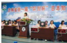
2007年全国大赛总决赛（东南财经学院）