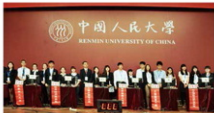
2013年全国大赛总决赛（中国人民大学）