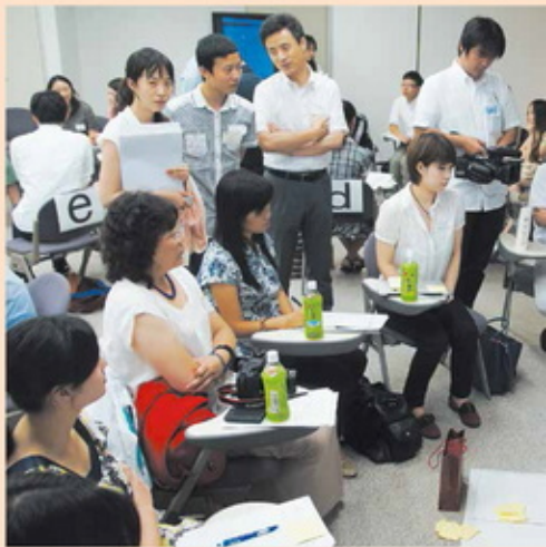
中日青年讨论会（2013年）