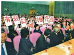
2005年东北地区大赛赛场（南京大学）