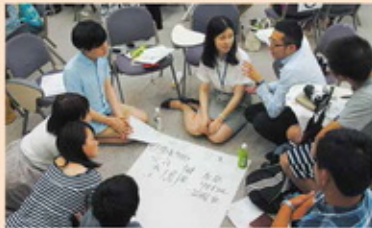
中日青年论坛会 (2013年)

强环境方面的立法、转变地方政府重经济轻环保的理念、培养企业的社会责任、普及民众环保意识、对青少年加强环境教育等。