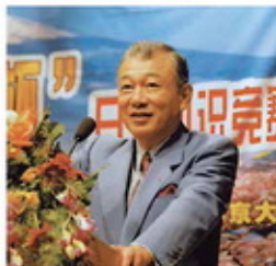
2006年东北地区大赛，日本经济论坛的半决赛颁奖（宁波大学）