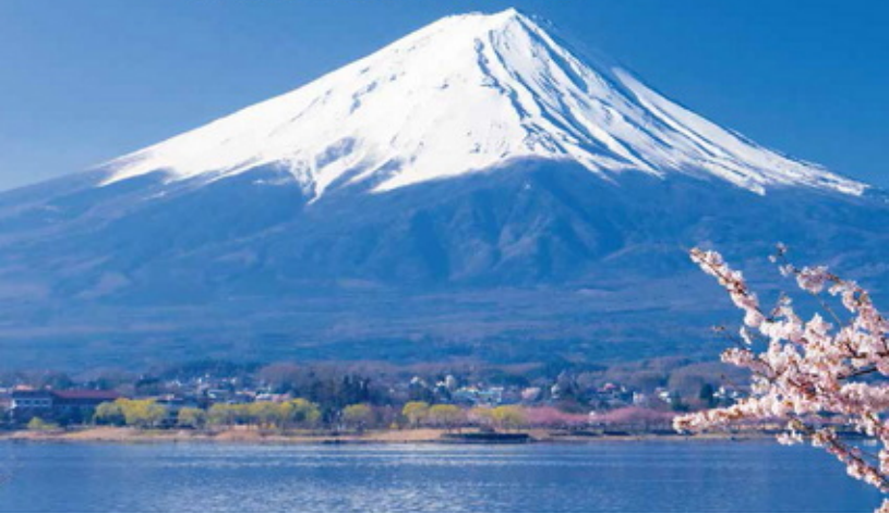
日本知识大赛概要