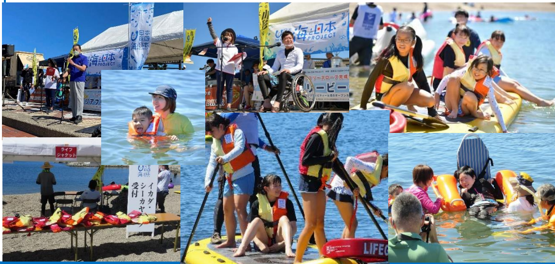
お披露目イベント身障者・健常者約300名参加、色んなマリナクティビティを楽しんだ（9月6日）障がい者のご家族から、まさか息子が海に入れるなんて！母親の涙にスタッフももらい泣き・・