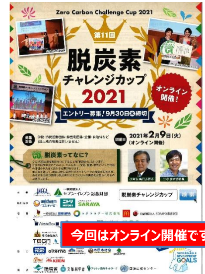
今回はオンライン開催です