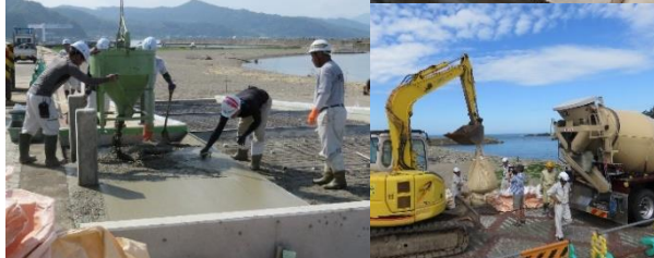
スロープ建設工事（8月1日～8月25日）砂浜を1.5m掘削しスロープの安定性・安全性を確保