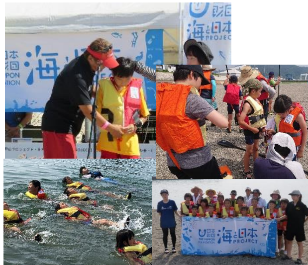
海を楽しく安全に楽しもう！ライフジャケット着用向上のレクチャー実施（8月5日、31日、9月6日）