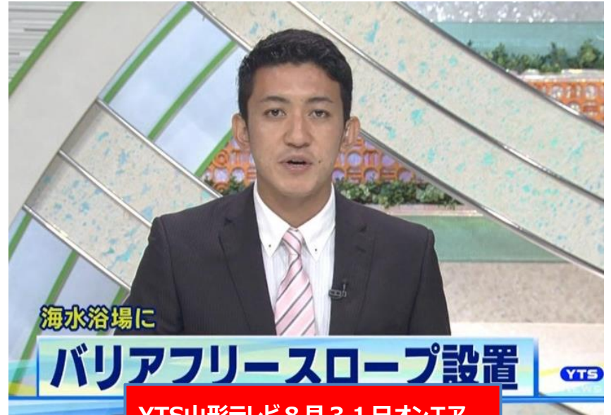
YTS山形テレビ 8月31日オンエア