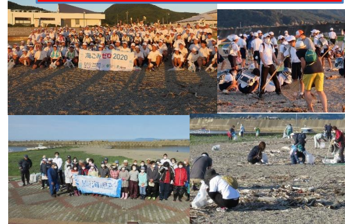
(上) 河北中学修学旅行の海ゴミ拾い（187名）9.2 (下) 町内会による一斉海ゴミ拾い（約350名）5.31