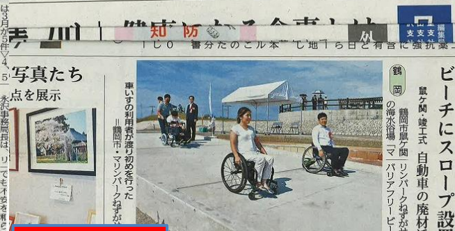
写真たち点を展示