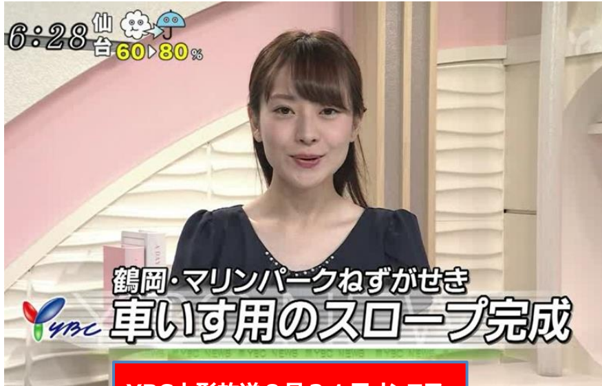
YBC山形放送 8月31日オンエア