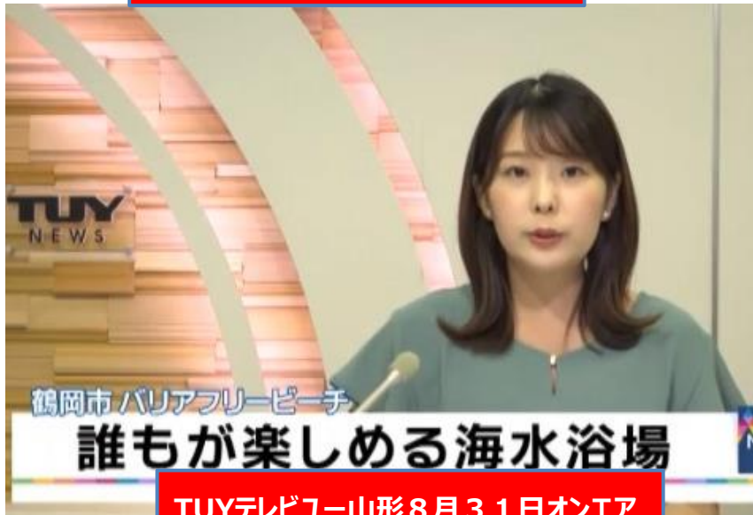
TUYテレビー山形 8月31日オンエア