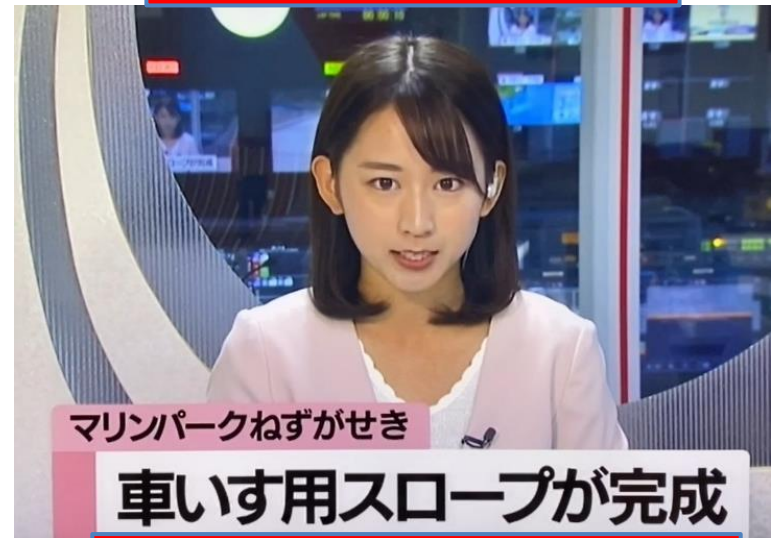
SAYさくらんぼテレビジョン 9月1日オンエア