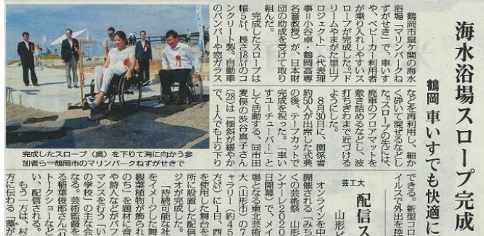
完成したスロープ(奥)を下りて海に向かう参加者ら一輪車用のマリンパークねがせがきで