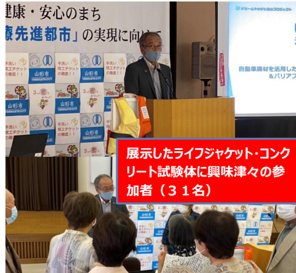
展示したライフジャケット・コンクリート試験体に興味津々の参加者（31名）