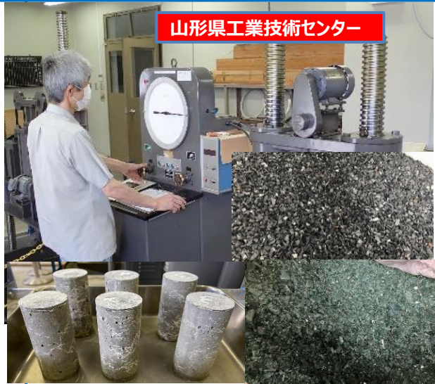
廃車のガラス・バンパーの粉碎とコンクリートに混合製作した試験体、県工業技術センターにより圧縮強度試験