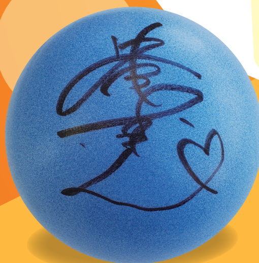
※プレゼント画像はイメージです