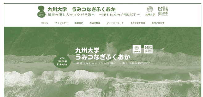
図 センターの海洋教育の発信のウェブサイト

海洋環境工学教育の拠点形成にむけ、遠隔技法と現場を合わせた海辺の教室や教材配信など、今後も発展させていきたい。