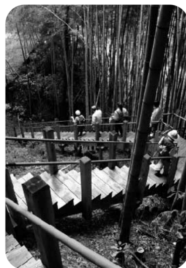
アスレチックみたい♪