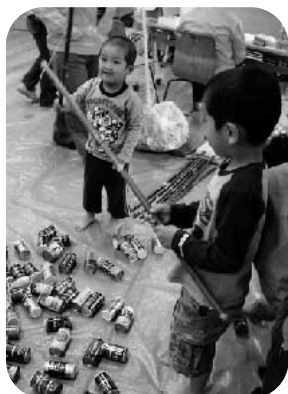
いくつ釣れるかな!?

「あそびの広場」に入ると、遊び道具がいくつも! あき缶つり かん や牛乳パックでミラクルキューブ作り、ドッチビーなどなど。子どもたちはみんなおばあちゃんに連れてきてもらっていたよ。