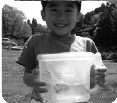
見て見て、カエルがいっぱい☆

今後の活動は、5/28、7/9、8/6、10/1、10/29に開催します。 ※今年度の参加者募集はしめきりました。また来年度ご応募ください。