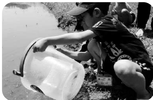
最後は田んぼに戻してあげたよ。