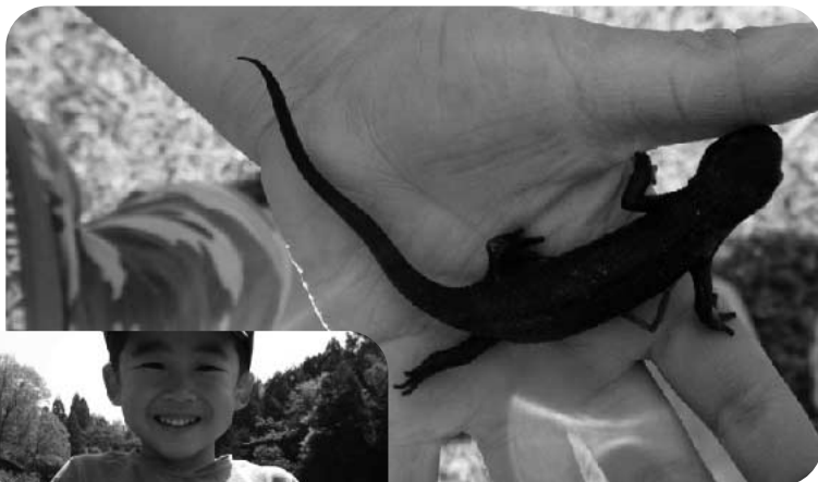
アカハライモリもいたよ。

最後はさわやかな風がふく中、飯谷のお米のおにぎりとお豚汁をいただいて、自然の恵みを感じました。