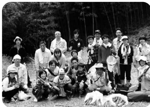
「タケノコいっぱい とったど～!!」

広島からの家族連れもあって、子供たちも大活躍！たけのこはとりきれないほど生えていました。1日で1000本くらい処理したことになるでしょう。たけのこが好きな人、石見銀山を守りたい人、来年ぜひ参加してね。