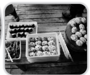
おにぎり おいしそ〜