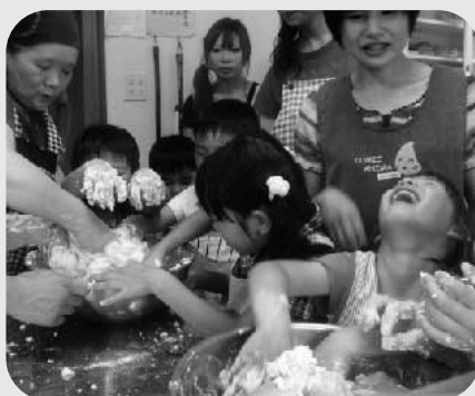
「楽しい～♪」よもぎ団子作り