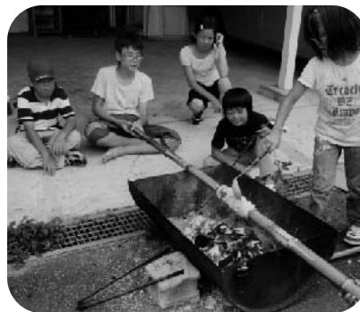
バーンクーヘン作り