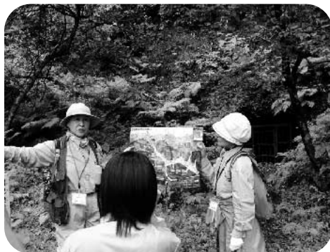
まぶ ここは間歩の入口です～