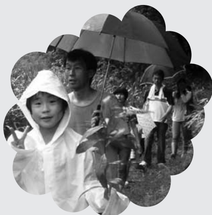
「くずの芽の天ぷらおいしかったヨ」