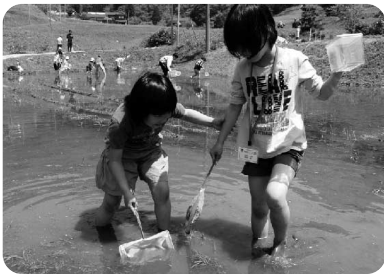
何がいるのかなあ～？

はじめはおそろおそろ田んぼに近づくみんな。それがしばらくすると“バシャバシャ！”と田んぼの中を走り回ったり、神経を集中して生き物をつかまえたりしていましたね。アメンボ、ミジンコ、カエル、おたまじやくし、カエルの卵、イモリ…などなど。たくさんの生き物が田んぼに住んでいる事が分かりました☆