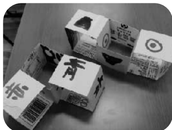
ミラクルキューブ