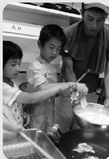
どきどき☆てんぷら作り