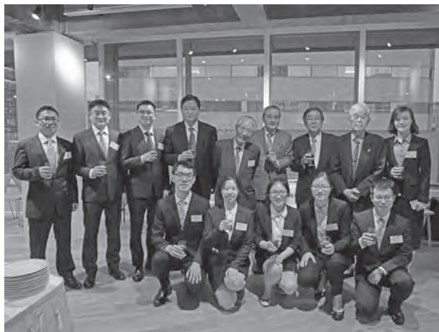
第41期攻读博士东京欢迎会