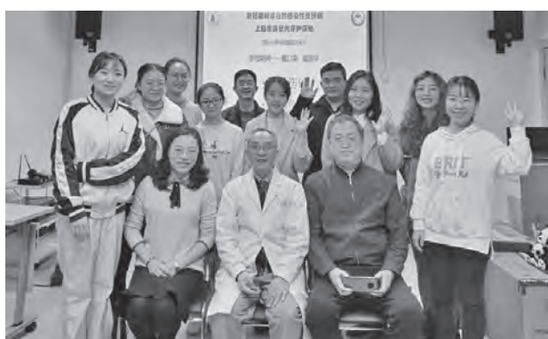
雅安基层医疗支援

2020年11月12日，笹川同学会基层医疗支援活动在雅安职业技术学院附属医院举行。该医院地处四川西部丘陵地区的雅安市，是一家二级甲等基层医疗机构。