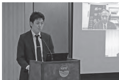
伊藤秀俊先生致辞（日本驻华使馆一等秘书）