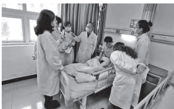
雅安基层医疗支援

冠期间诊治的感染性皮肤病》学术专题讲座，来自雅安职业技术学院附属医院皮肤科的二十余名医护人员共同聆听了冉教授的精彩分享。冉教授以一系列鲜生动人的病例为大家展示了在诊疗肉芽肿疾病时可能遇到的相关问题，讲座激情澎湃、引人入胜，现场听众纷纷表示启迪智慧、受益匪浅。