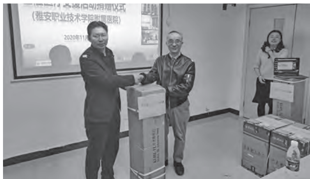
雅安基层医疗支援