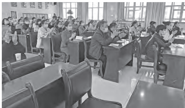
线下基层医疗支援

参加培训活动的很多医生表示，通过培训可使用智能软件进行分析，智能软件操作简便、取代了既往繁杂的筛查流程，对于基层单位继发性高血压的初筛工作具有重要意义。