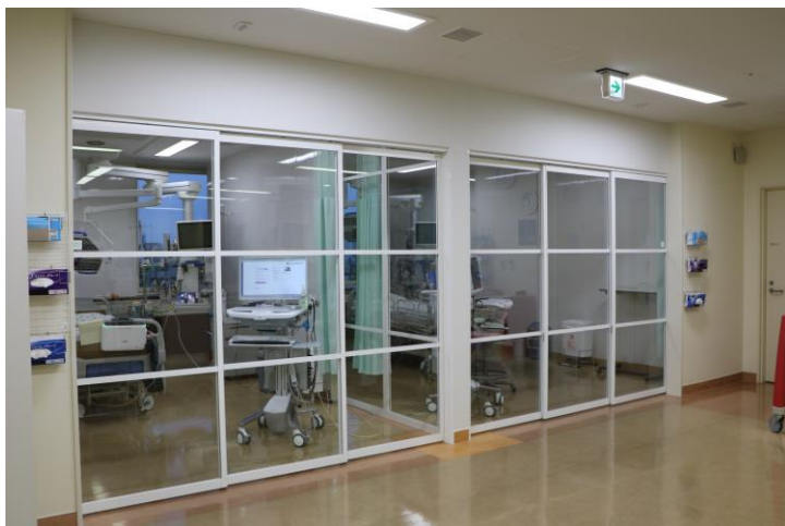
ICU個室化工事（可動式扉）