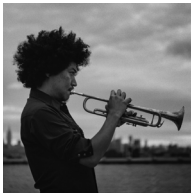
黒田卓也 Takuya Kuroda

1980年、兵庫県生まれ。12歳からトランペットを始め、神戸、大阪のジャズクラブにて16歳から演奏を始める。2003年に渡米し、ニュースクール大学ジャズ科に在学時から有名クラブに出演するなど、精力的に活動。2014年には名門ブルーノートと日本人としては初の契約を果たしメジャーデビュー作「Rising Son」、2016年には西海岸の老舗メジャーレーベルより「Zigzagger」を発表。