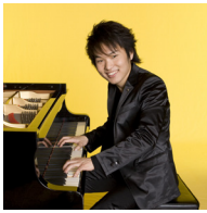
松永貴志 Takashi Matsunaga

1986年、兵庫県生まれ。17歳でメジャーデビュー。ハービー・ハンコックとの共演をきっかけに、世界のミュージシャンから喝采を集める。欧米、アジア各国で「STORM ZONE」発表。NYブルーノート・レーベルで最年少のリーダー録音記録を樹立。2015年、ポーランド「Manggha 館」設立20周年式典に招待され大統領の前で演奏し、博物館のテーマ曲を作曲。2017年、世界10カ国ツアーを開催。