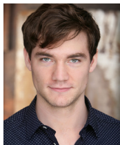
ダニエル・デュラント Daniel Durant