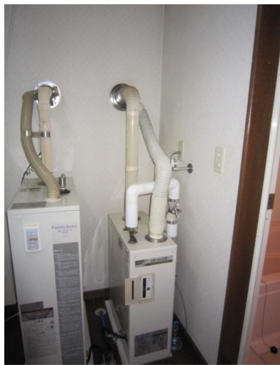
ボイラーが古くなったのでシャワーの時お湯ではなく水が出る