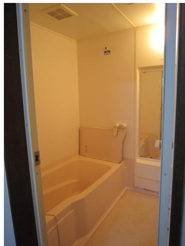
改修前の浴室全景