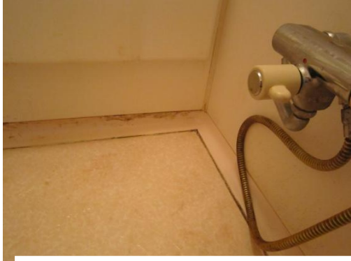
床からの立ち上がりに穴が空いている