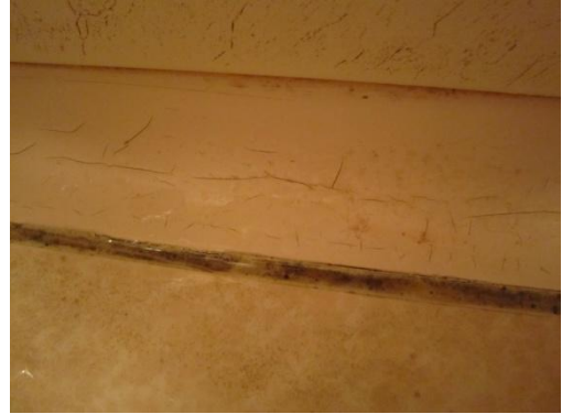
床面と側面はひび割れている