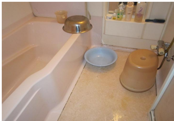
隅々にカビがはえてやすくなっている