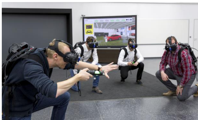
VR ホロデッキ

ユーザーは、VR 眼鏡を装着し、ハンドコントローラー2基を用いてインターアクションを行う。各ユーザーはパワフルなモバイル PC を内装した重さ 3kg のバックパックを背負う。PC は、データ交換を制御する中央ワークステーションに WiFi 接続されている。最大 6 人のユーザーが同時に自動車の周囲を歩く VR 体験をシェアすることができる。将来的には、他の拠点のメンバーの同時参加も可能にする。