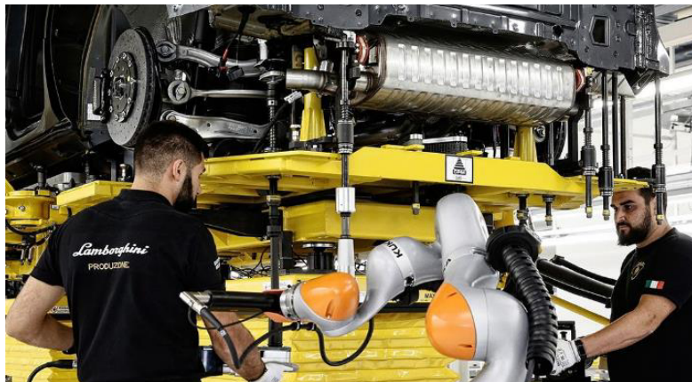
ロボットとの協働

協働ロボットが作業員を支援し、ウィンドウの接着、車体の下のねじ止め、ハンドルの組立などの高品質が要求される繰り返し作業における作業員の負担を軽減する。