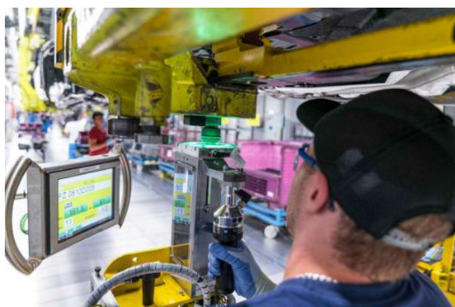
アルゴリズムによる状況確認

アルゴリズムは、自動車組立工程の何千個ものボルト接続を分析し、エラーが発生する以前にエラーを特定し、信頼性の高い重要な情報を提供する。緑色のライトは異常がないことを示す。