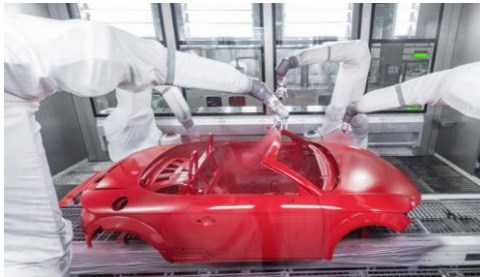
ロボットによる塗装