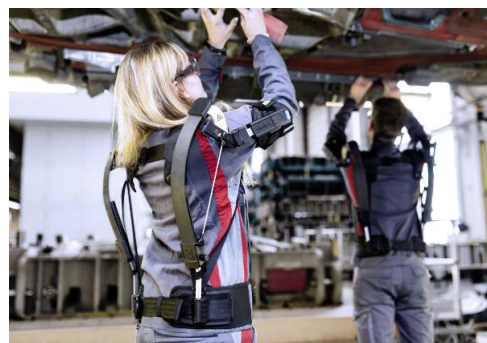
頭上作業用外骨格型ロボット