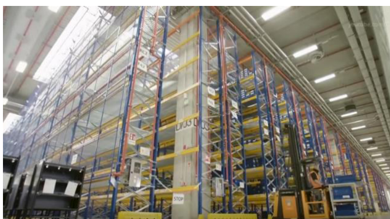
新ロジスティクスセンター