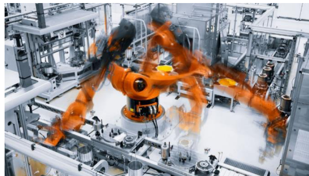
ロボットによる製造