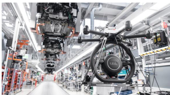
ドローンによる部品輸送