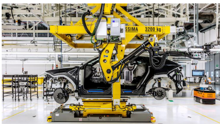
ロボットによる製造作業