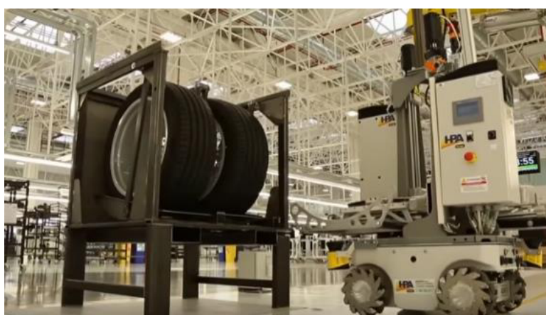
タイヤの自動搬送