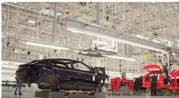
自走式ロボット (AGV) による移動

自走式ロボット (AGV) が車両及び資材輸送システムとして利用される。このシステムにより、建物のレイアウトの柔軟性が維持できる。