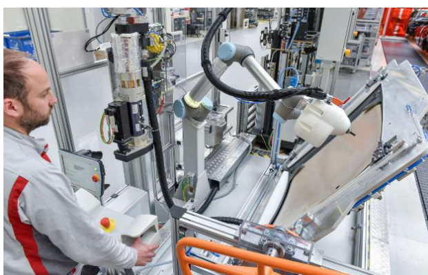
協力ロボット「KLARA」

人間から隔離された従来の製造ロボットと違い、保護フェンスなしに作業員と並んで作業を行うことができる軽量協力ロボットは、スマートファクトリーには不可欠な存在で、既に同様のロボットがハンガリー工場、ベルギー工場でも利用されている。