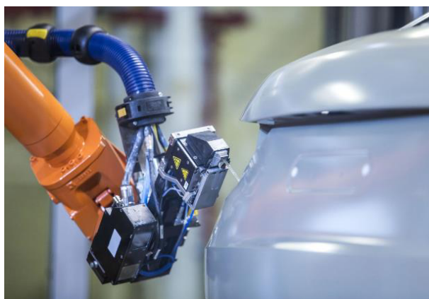
デジタルシーリングロボット