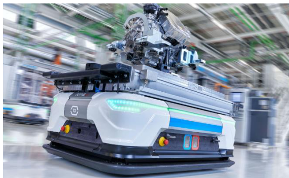
自動搬送システム

AUDI のスマートファクトリーは、革新的技術とシステムが生産ラインをどのように効率化し、時間とコストの節約につながるかを示している。ハンガリーの工場は最初の試みで、スマートファクトリー戦略は 2035 年まで続く。 14