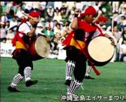
沖縄全島エイサーまつり