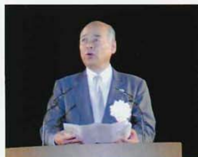
札幌商工会議所 高向会頭