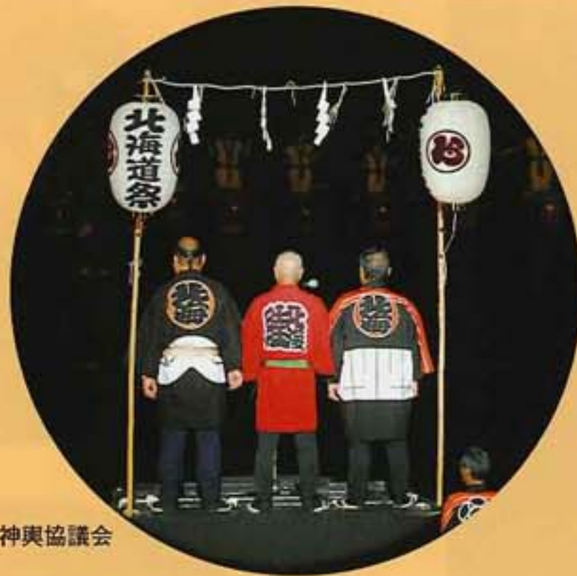
北海道神輿協議会