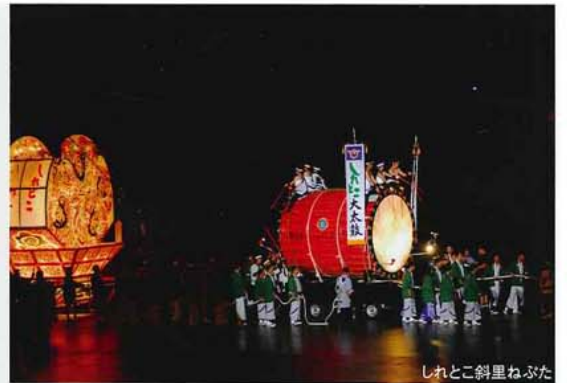
しれとこ斜里ねぶた