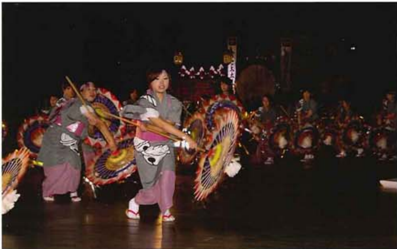
深川しゃんしゃん傘踊り