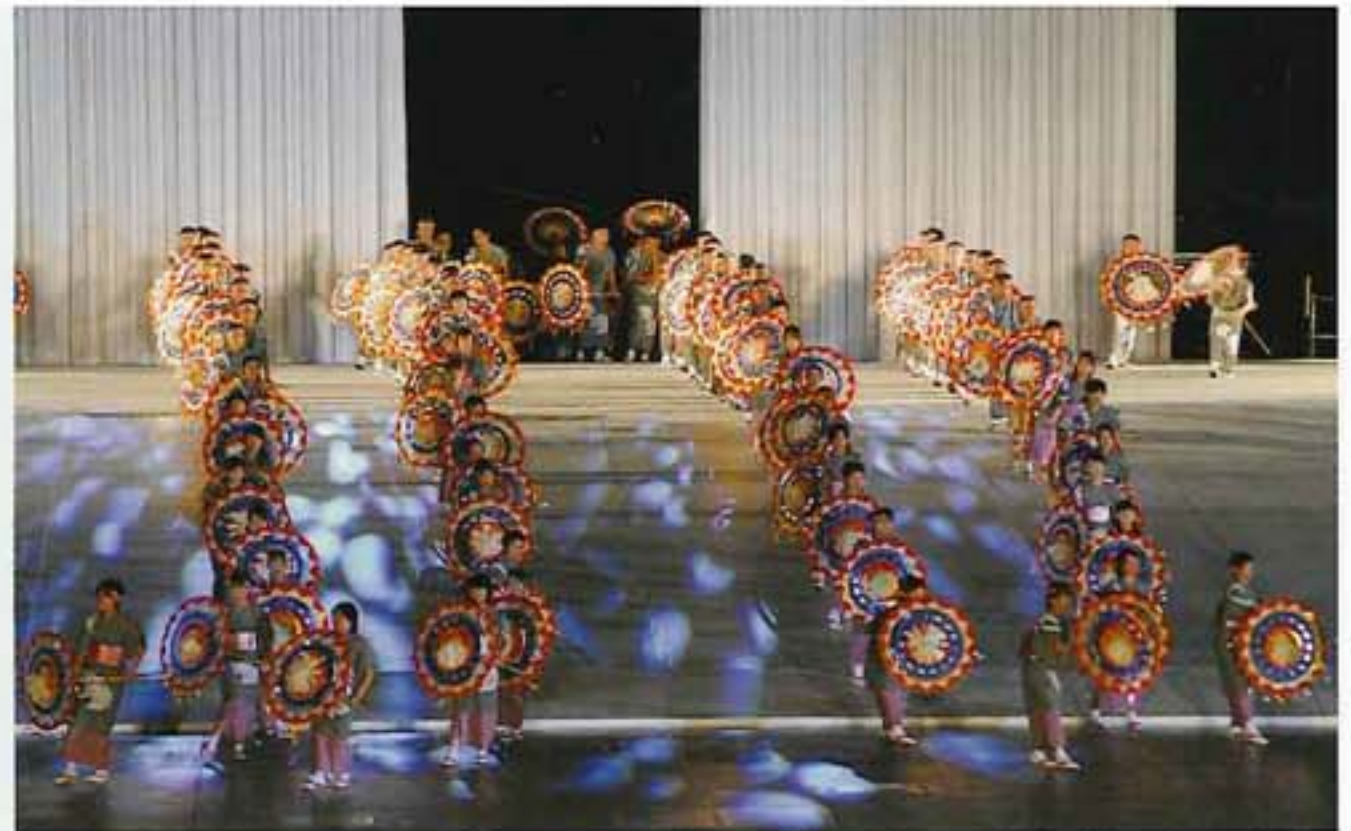
深川しゃんしゃん傘踊り