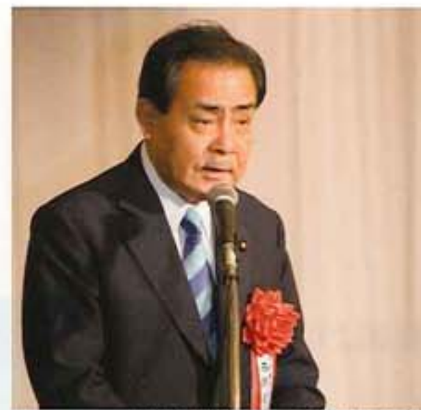
経済産業副大臣 西野あきら様