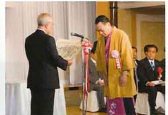
盛岡さんざ踊り実行委員会