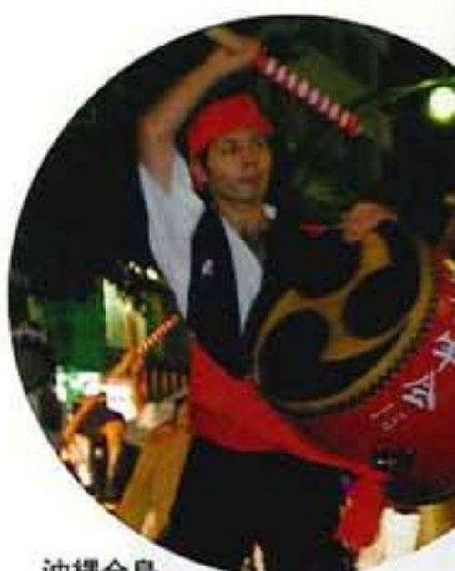
沖縄全島 エイサーまつり