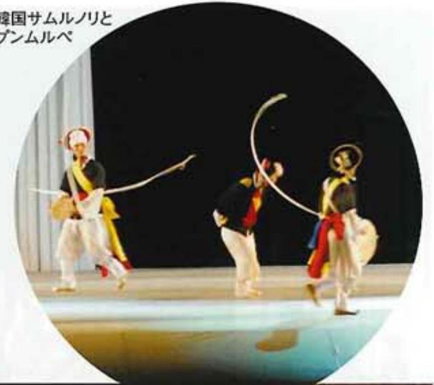
韓国サムルノリと ブンムルベ