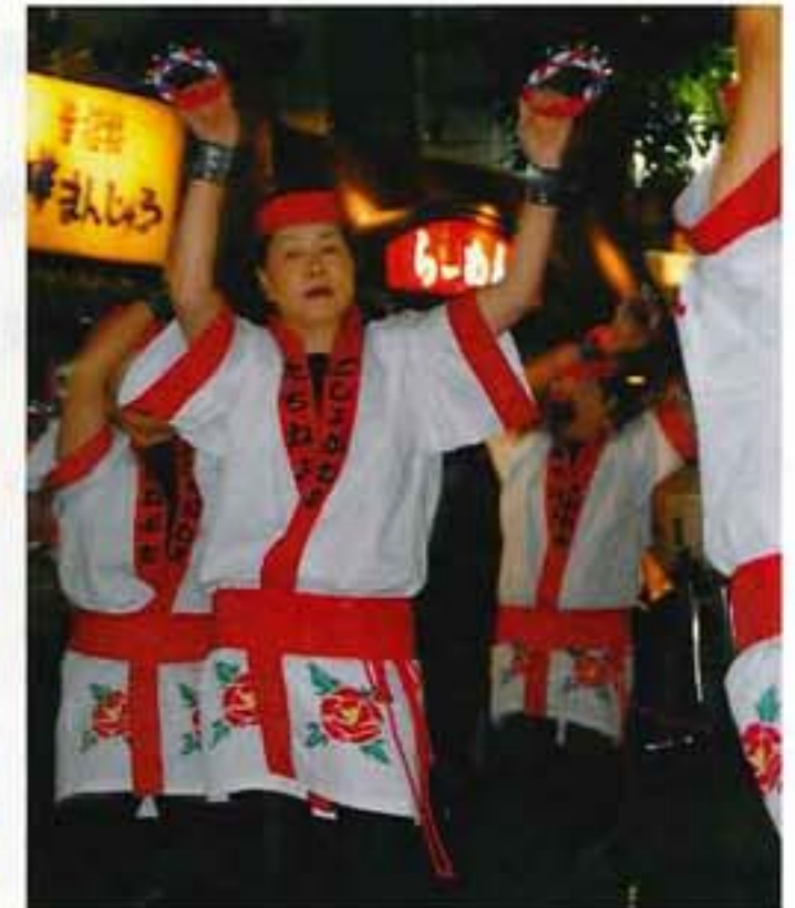
五所川原立佞武多