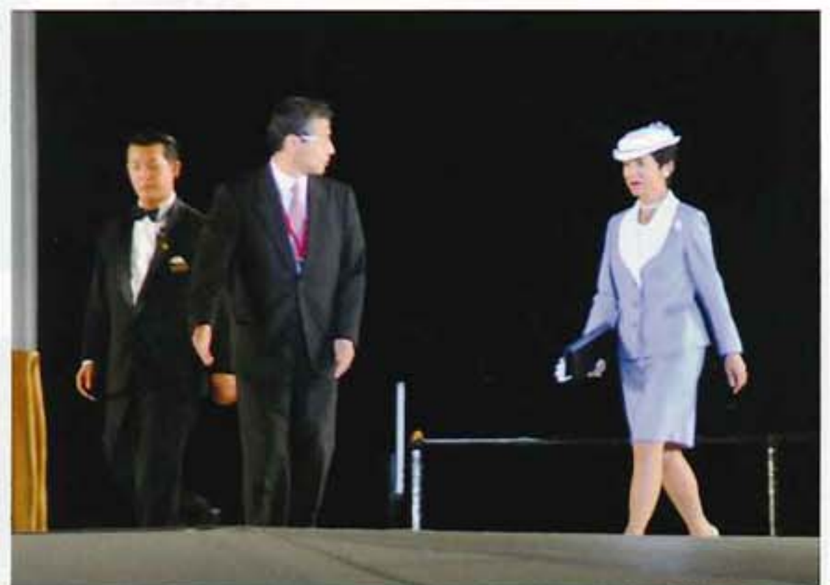
高円宮妃殿下御入場