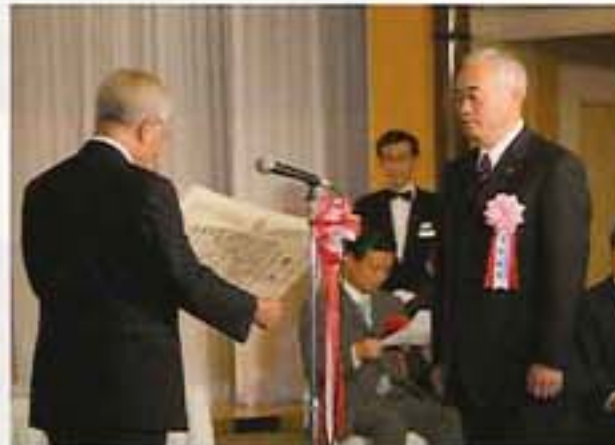
弘前ねぶた保存会