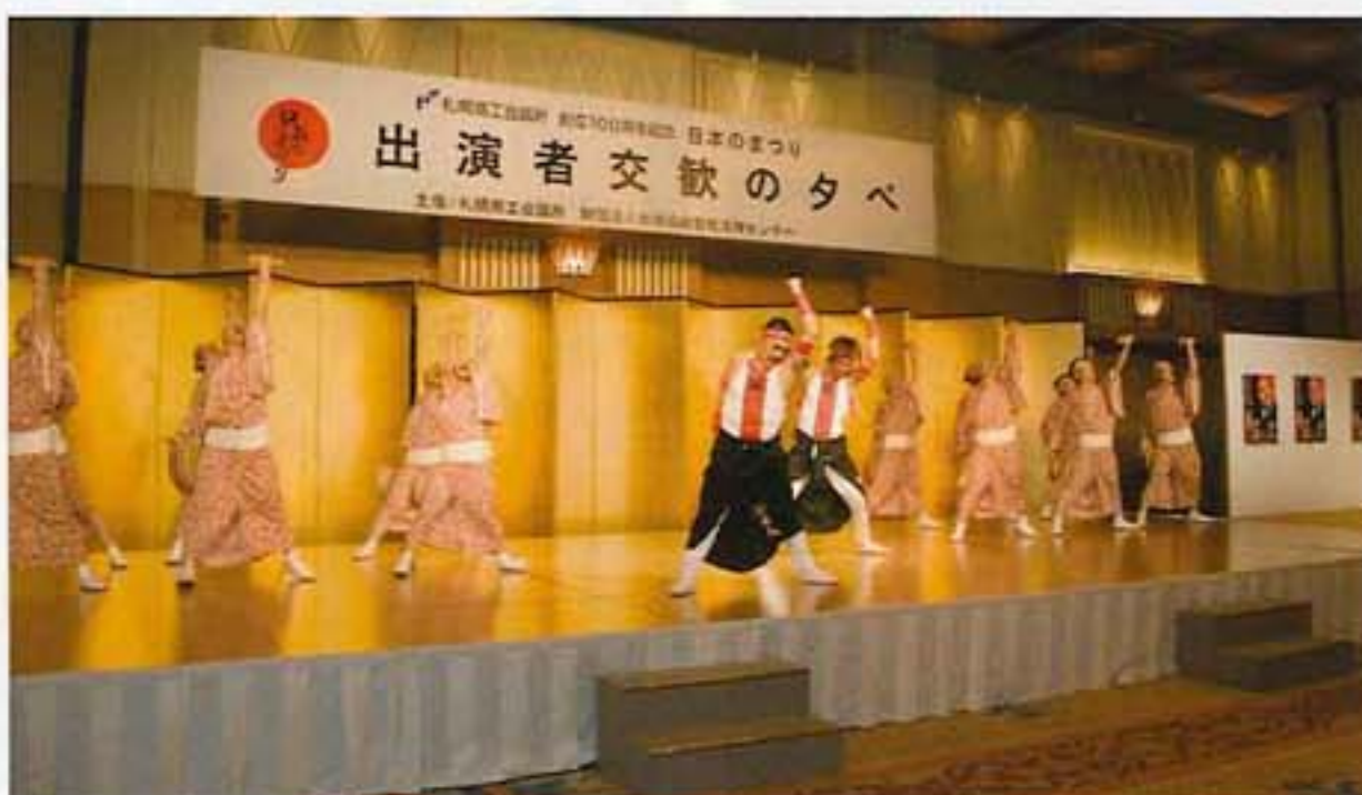
YOSAKOIソーラン祭り(新琴似天舞龍神)