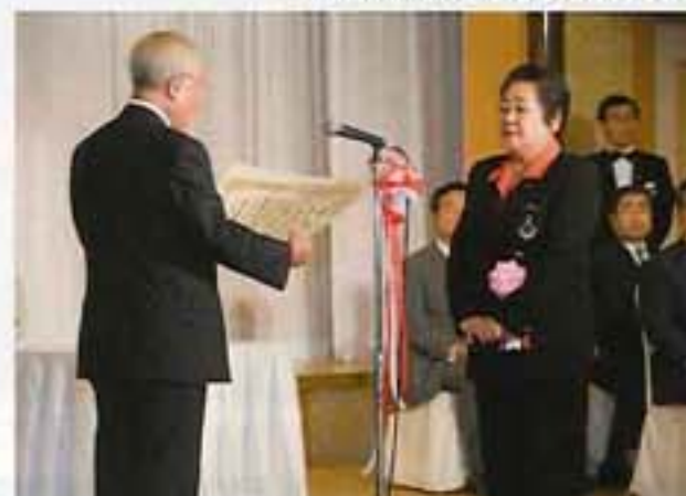
沖縄全島エイサーまつり実行委員会