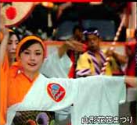
高千穂花笠まつり