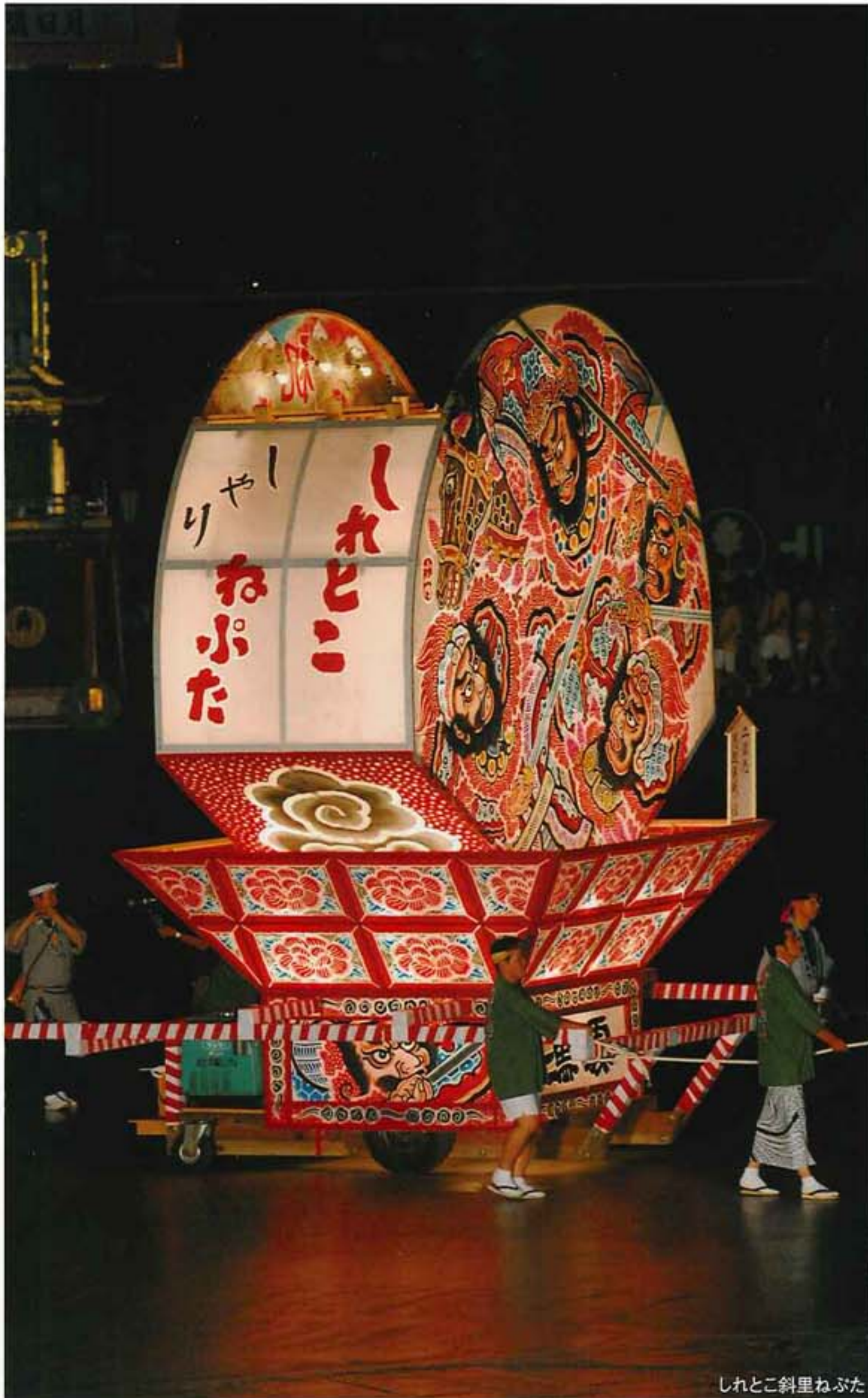
しれとこ斜里ねぶた