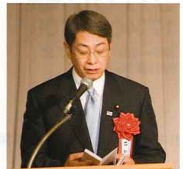
国土交通大臣政務官 石田真敏様