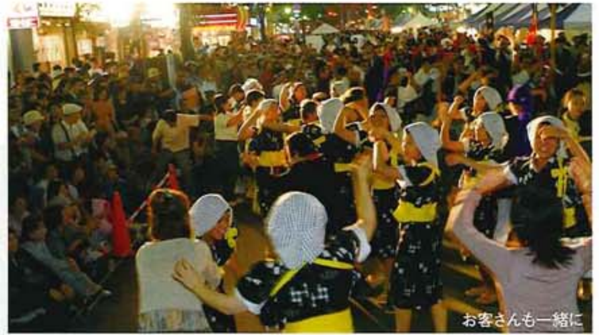
お客さんと一緒に

日本全国のまつり8団体、中国・韓国より各1団体、合計10団体、出演者総数222名が関東以北随一の歓楽街「すすきの」に設けられた歩行者天国において幻想的なパフォーマンスを繰り広げました。沿道では約2万人の観衆が出演者に拍手を送り、出演者と一緒に踊りだす観客も多数にのぼるなど会場は大いに盛り上がりました。