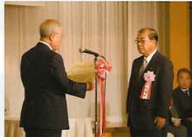
青森ねぶた祭実行委員会