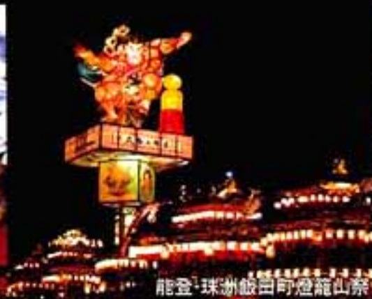
能登・珠洲・能登町・野登籠山祭