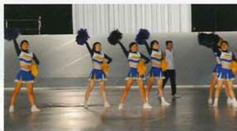
北海道チアリーディング連盟