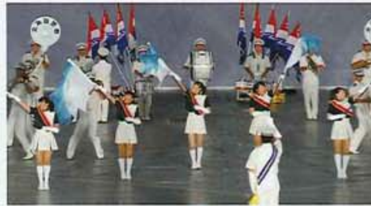
道警カラーガード隊