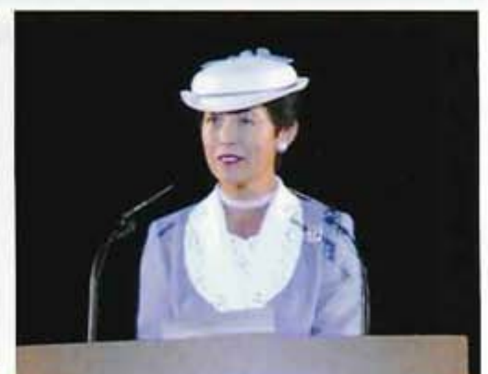
高円宮妃殿下お言葉