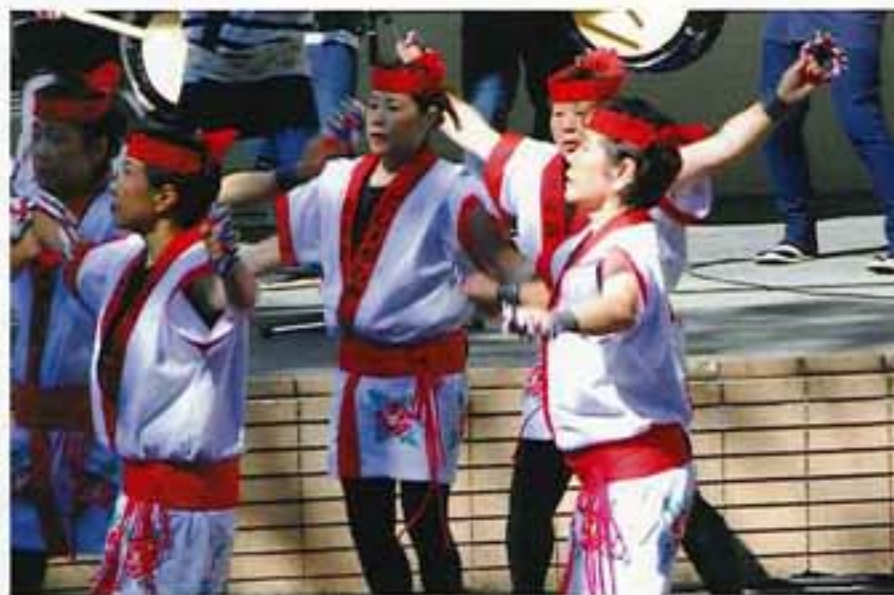
五所川原立倭武多