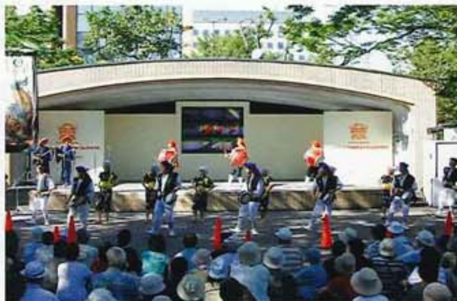
沖縄全島エイサーまつり