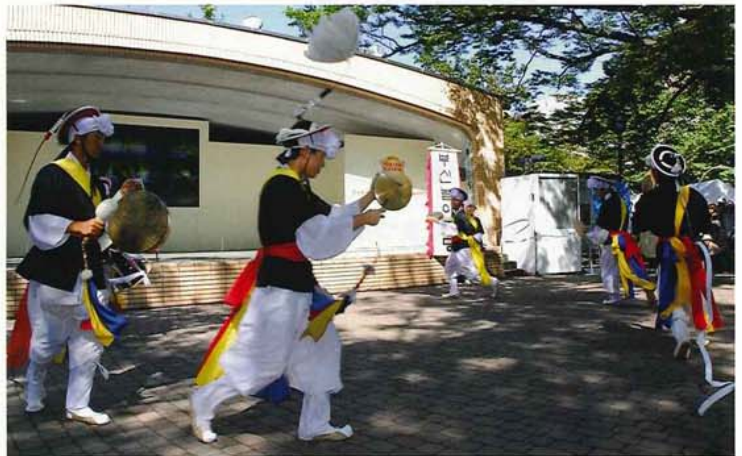
韓国サムルノリとブンムルベ