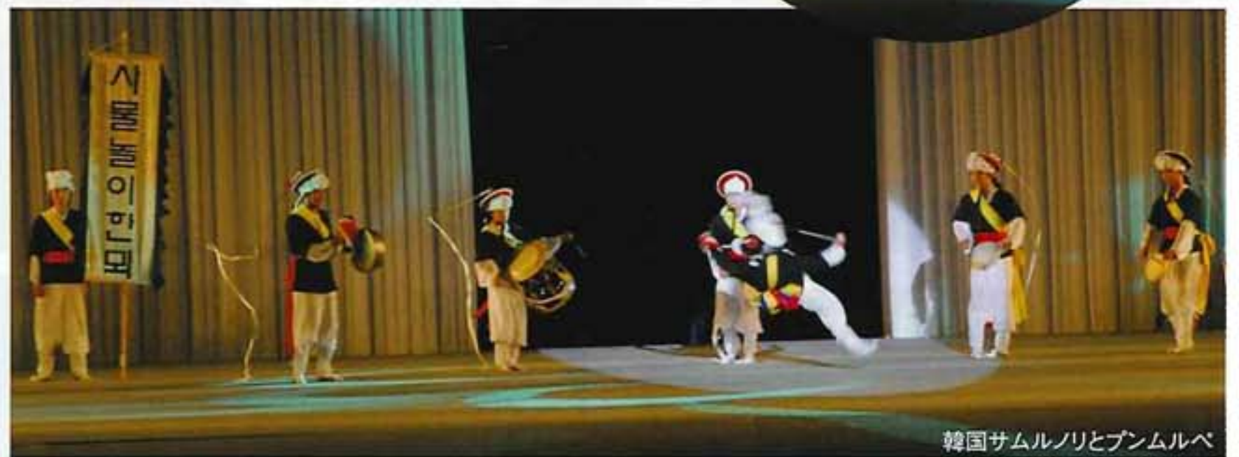
韓国サムルノリとブンムルベ