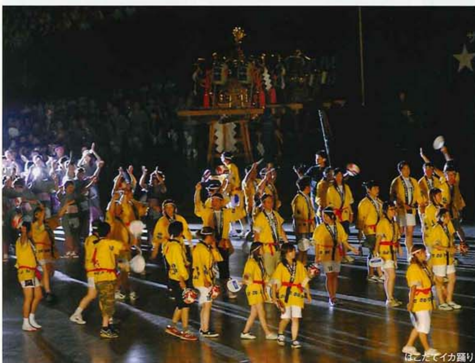
はこだてイカ踊り