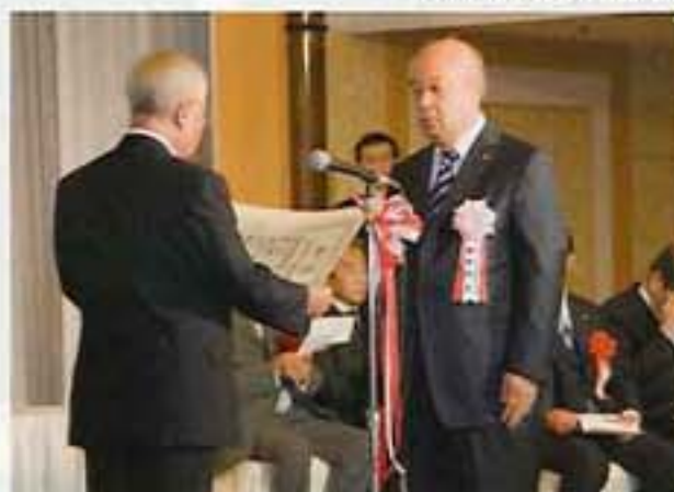
YOSAKOIソーラン祭り組織委員会