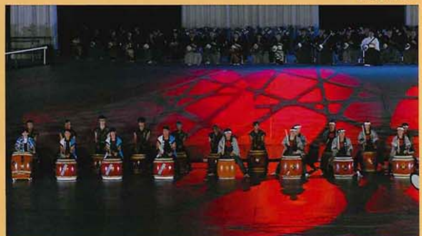
(財)日本太鼓連盟北海道連合会