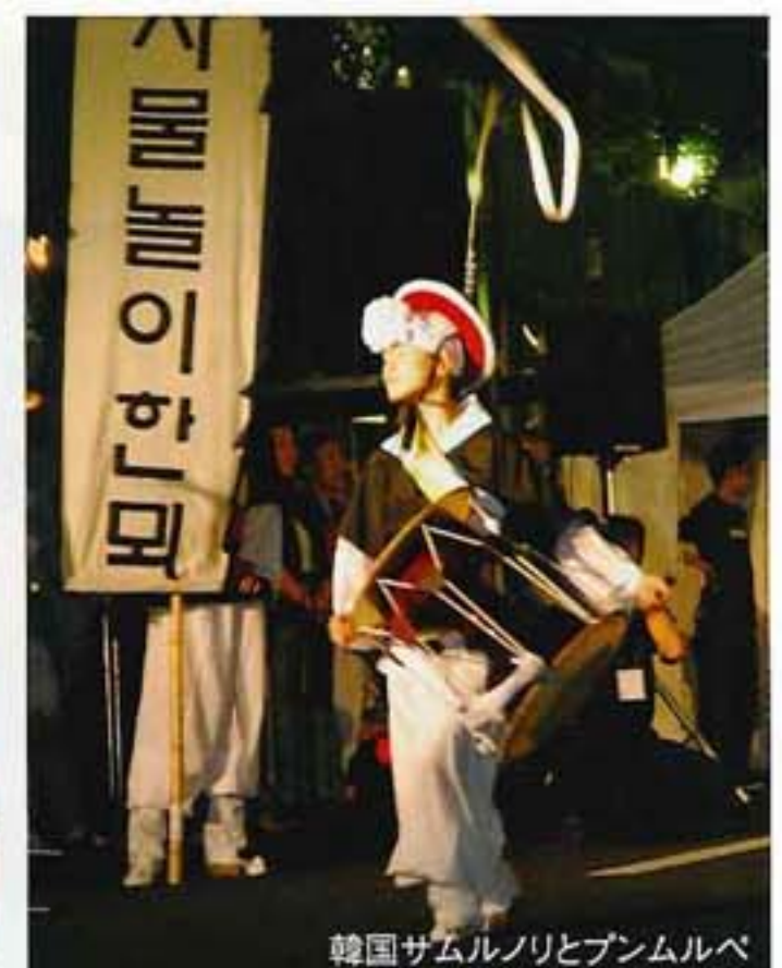
韓国サムルノリとブンムルベ