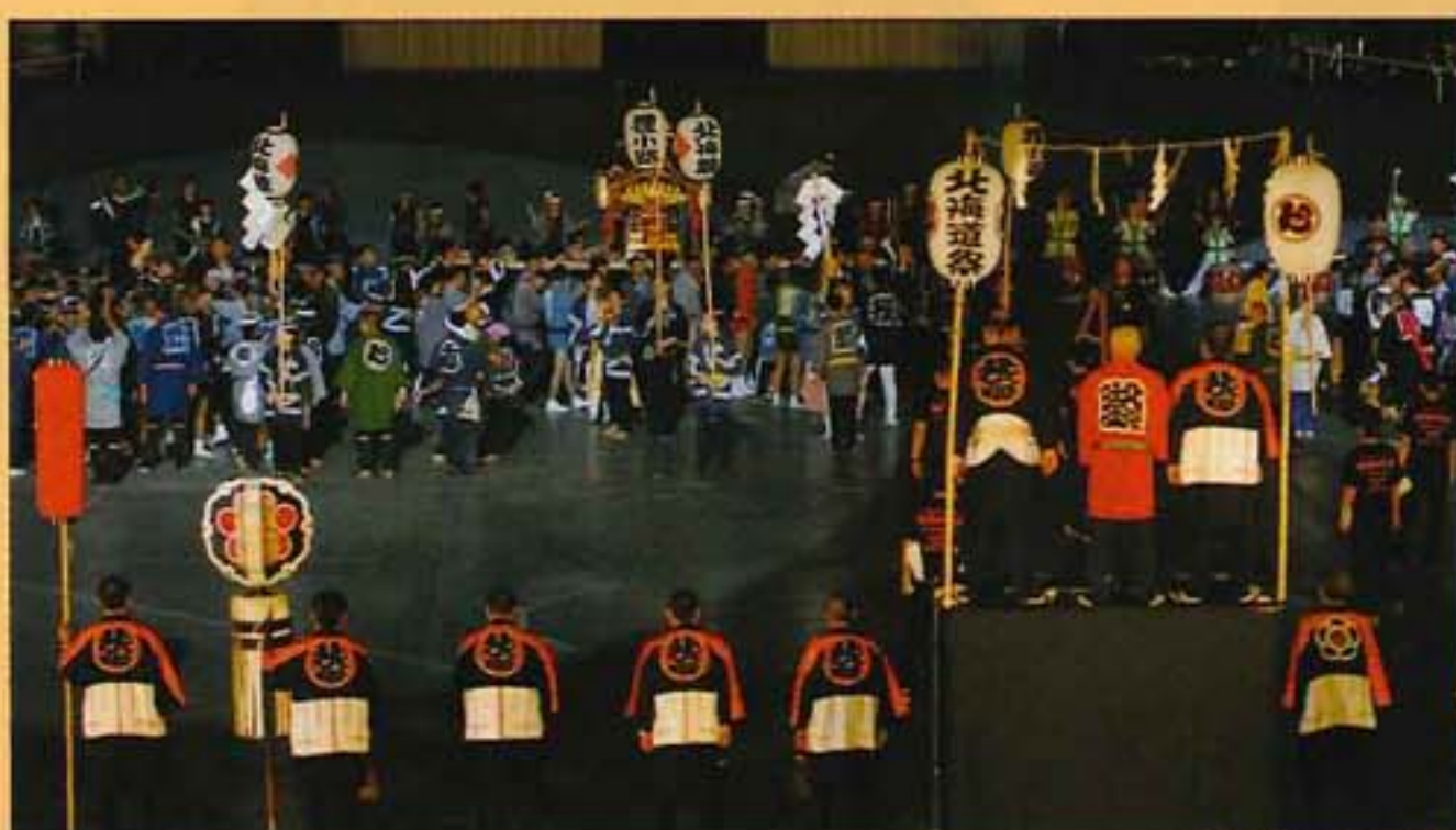
北海道神輿協議会