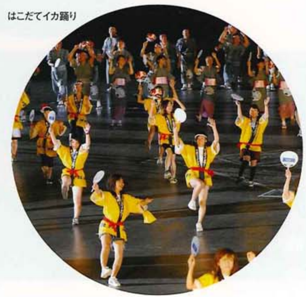
はこだてイカ踊り