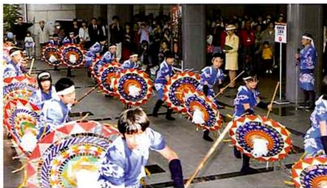
地元小・中学生による「因幡の傘踊」(鳥取市立国府東小学校、鳥取市立国府中学校)