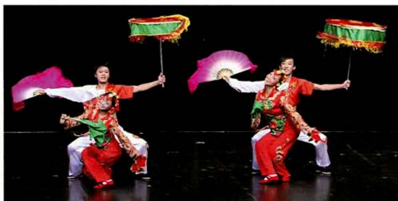
中国の伝統舞踊と音楽 (中国河北省)