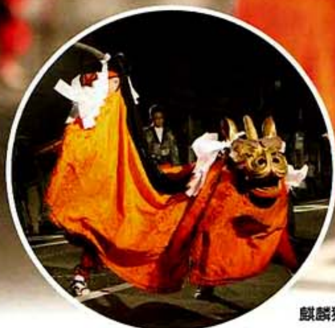
麒麟獅子舞パレード