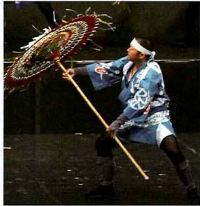
因幡の傘踊 (鳥取県鳥取市)