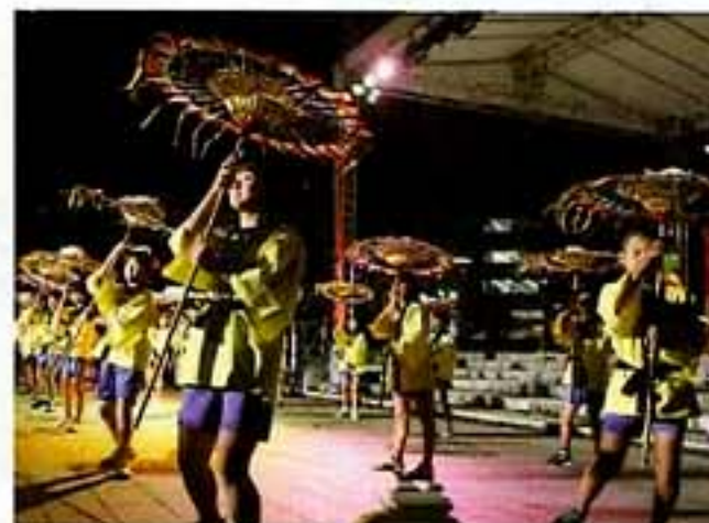
鳥取しゃんしゃん傘踊り