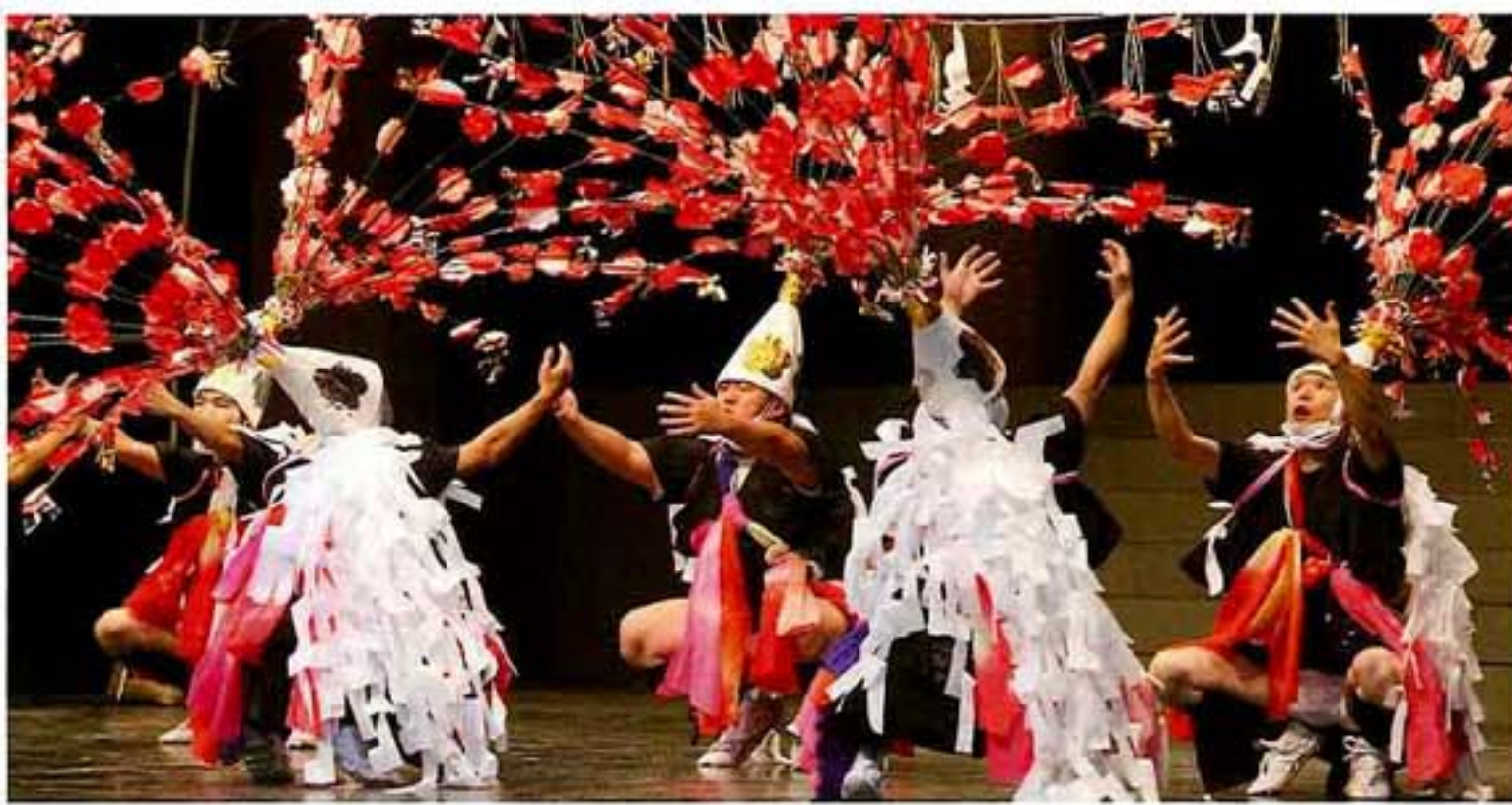
地域伝統芸能大賞 藤守の 保存継承賞受賞 田遊び (静岡県焼津市)