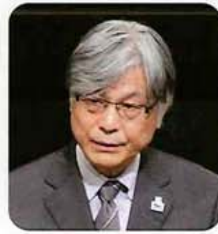
御来賓挨拶 本保 芳明 国土交通省観光庁長官