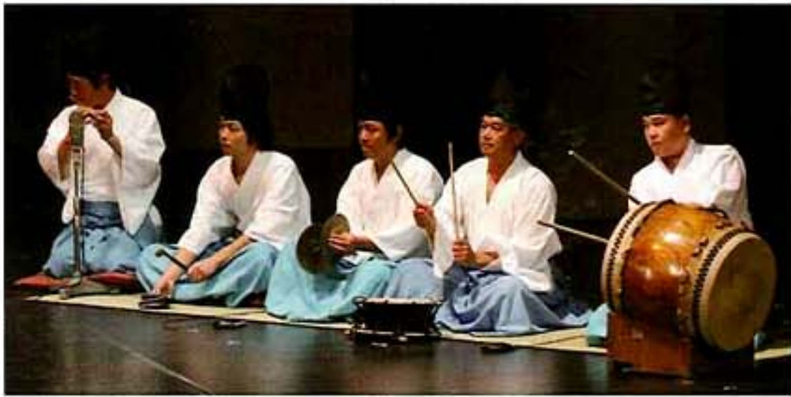
地域伝統芸能大賞 地域振興賞受賞 庄内神楽 (大分県由布市)