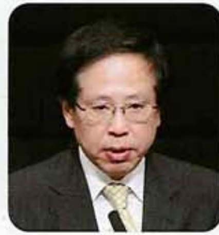
御来賓挨拶 富田 健介 経済産業省 商務情報政策局審議官