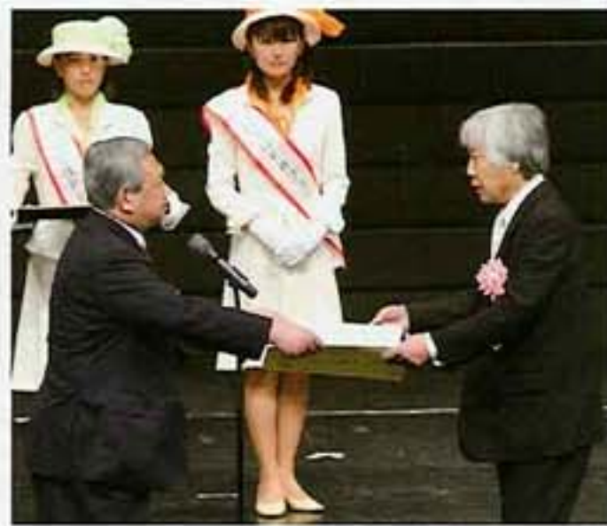
登米秋まつり協賛会