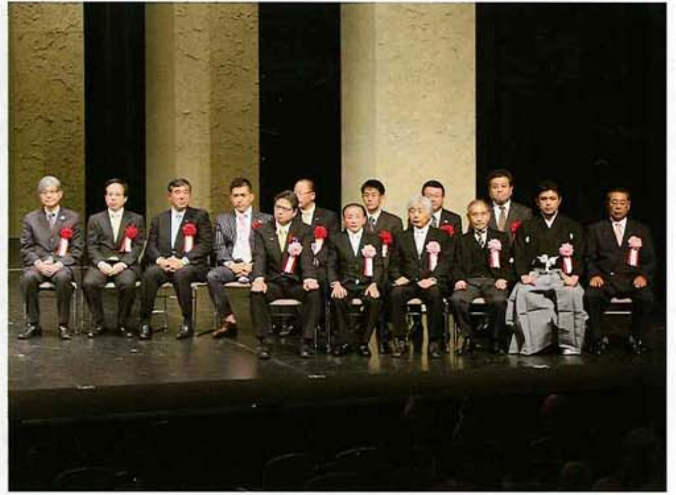
来賓及び受賞者の皆さん