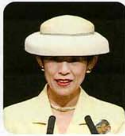
お言葉 高円宮妃殿下