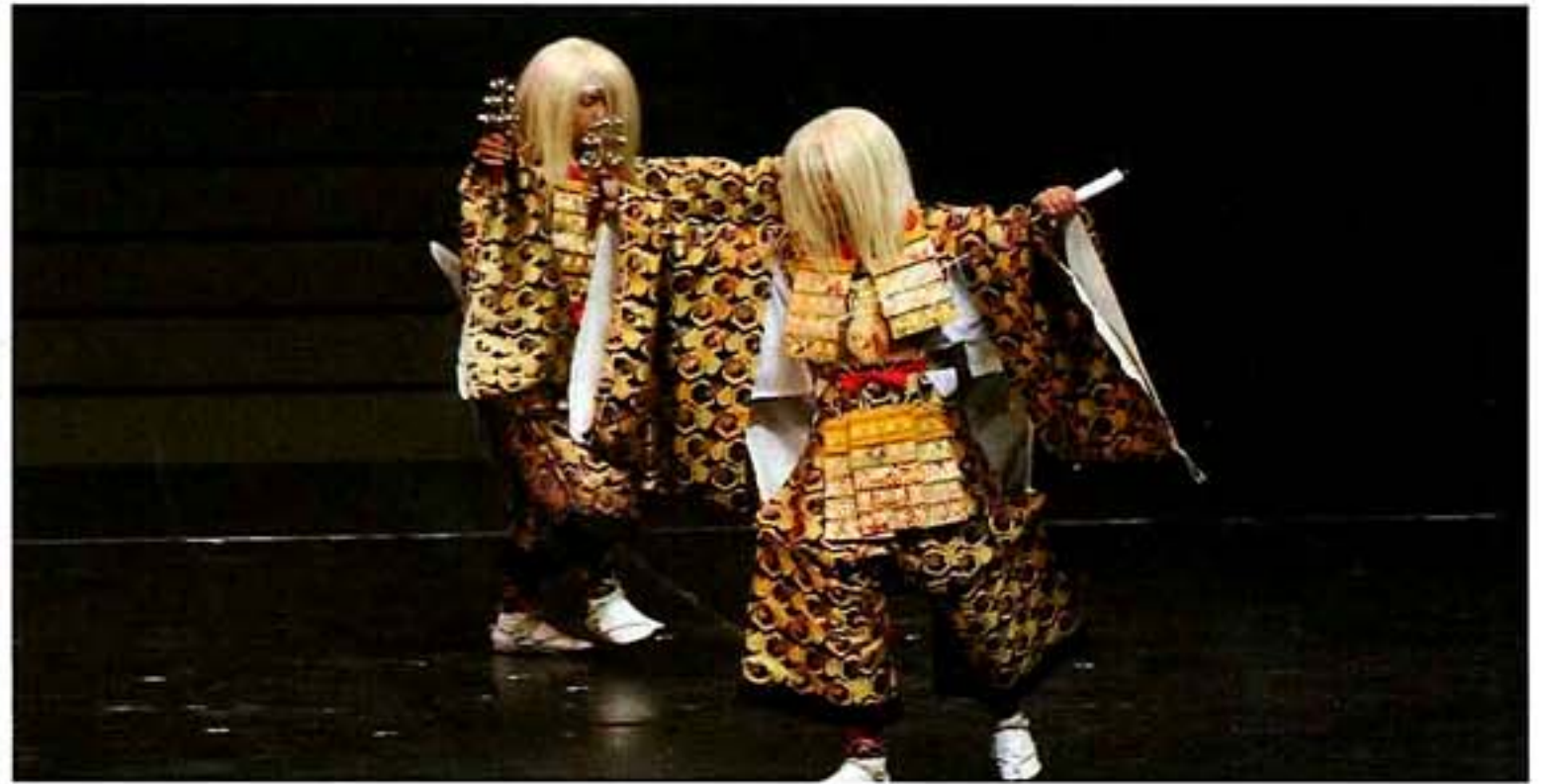
高円宮殿下記念 地域伝統芸能賞受賞 秩父祭 (埼玉県秩父市)