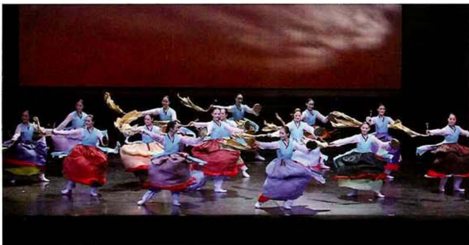
【平和】 韓国の伝統舞踊 (韓国江原道)