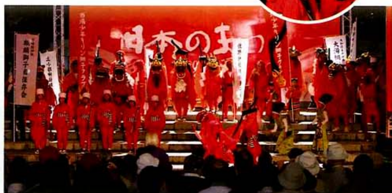
市場神社麒麟獅子舞