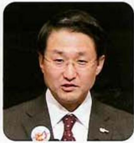
主催者挨拶 平井 伸治 鳥取県知事