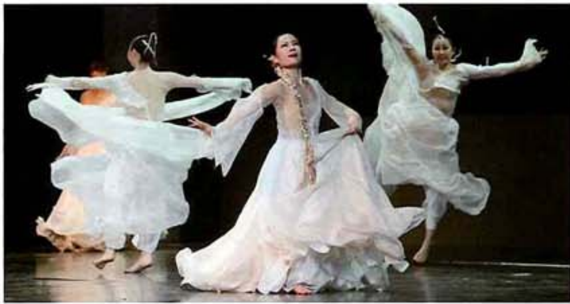
【恋歌】 韓国の伝統舞踊 (韓国清州市)