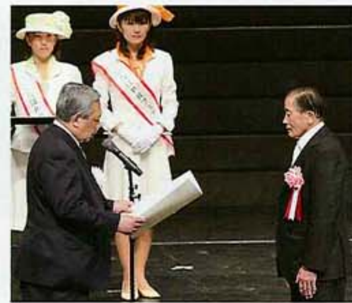
藤守の田遊び保存会