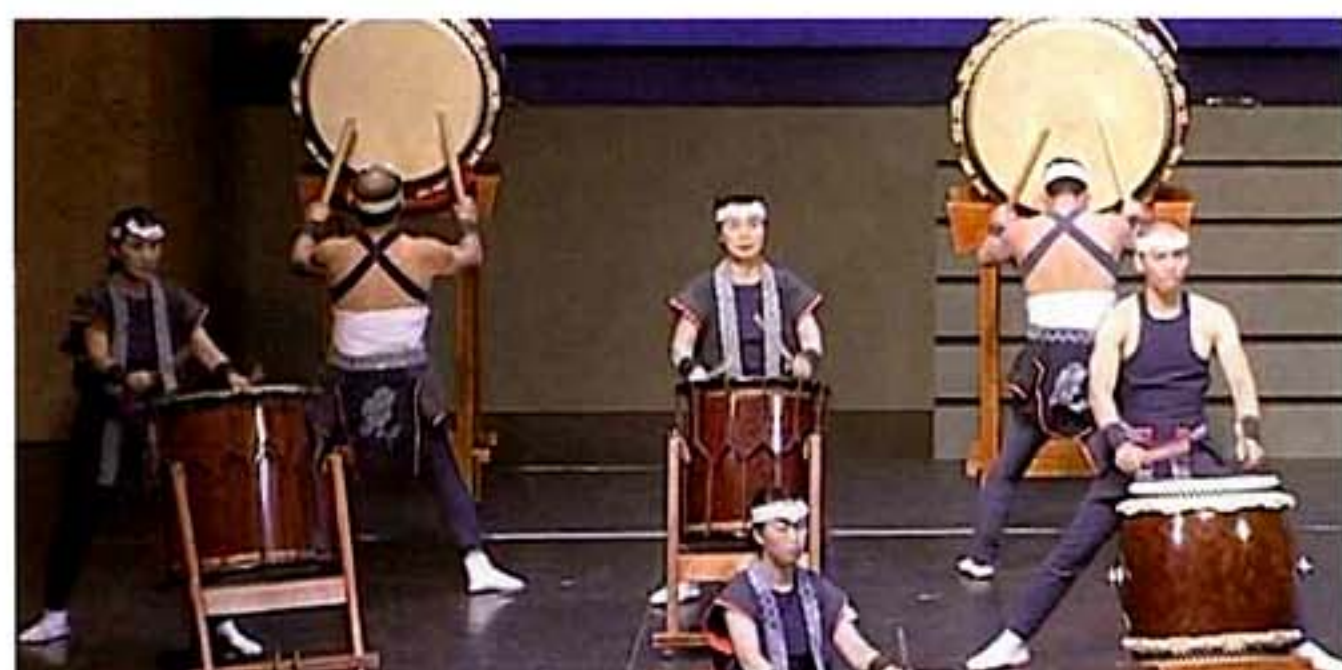
倉吉打吹太鼓 (鳥取県倉吉市)