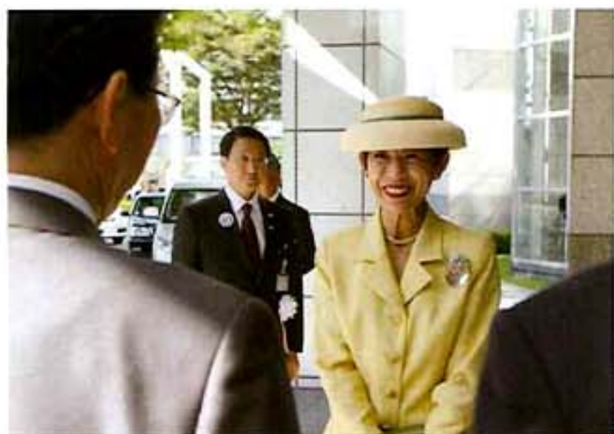
とりぎん文化会館玄関にて