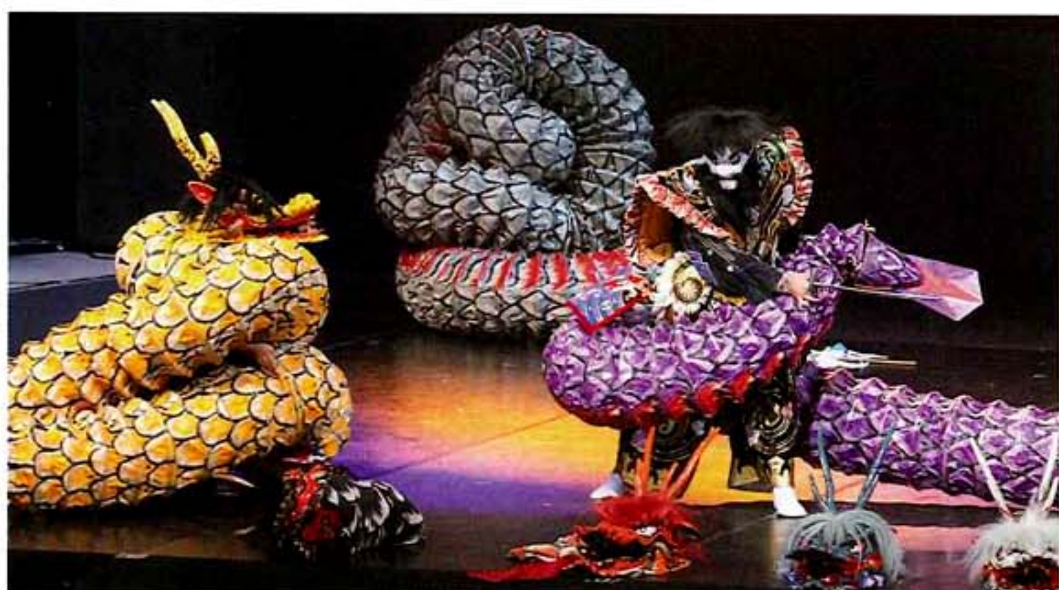
荒神神楽 (鳥取県日野町)