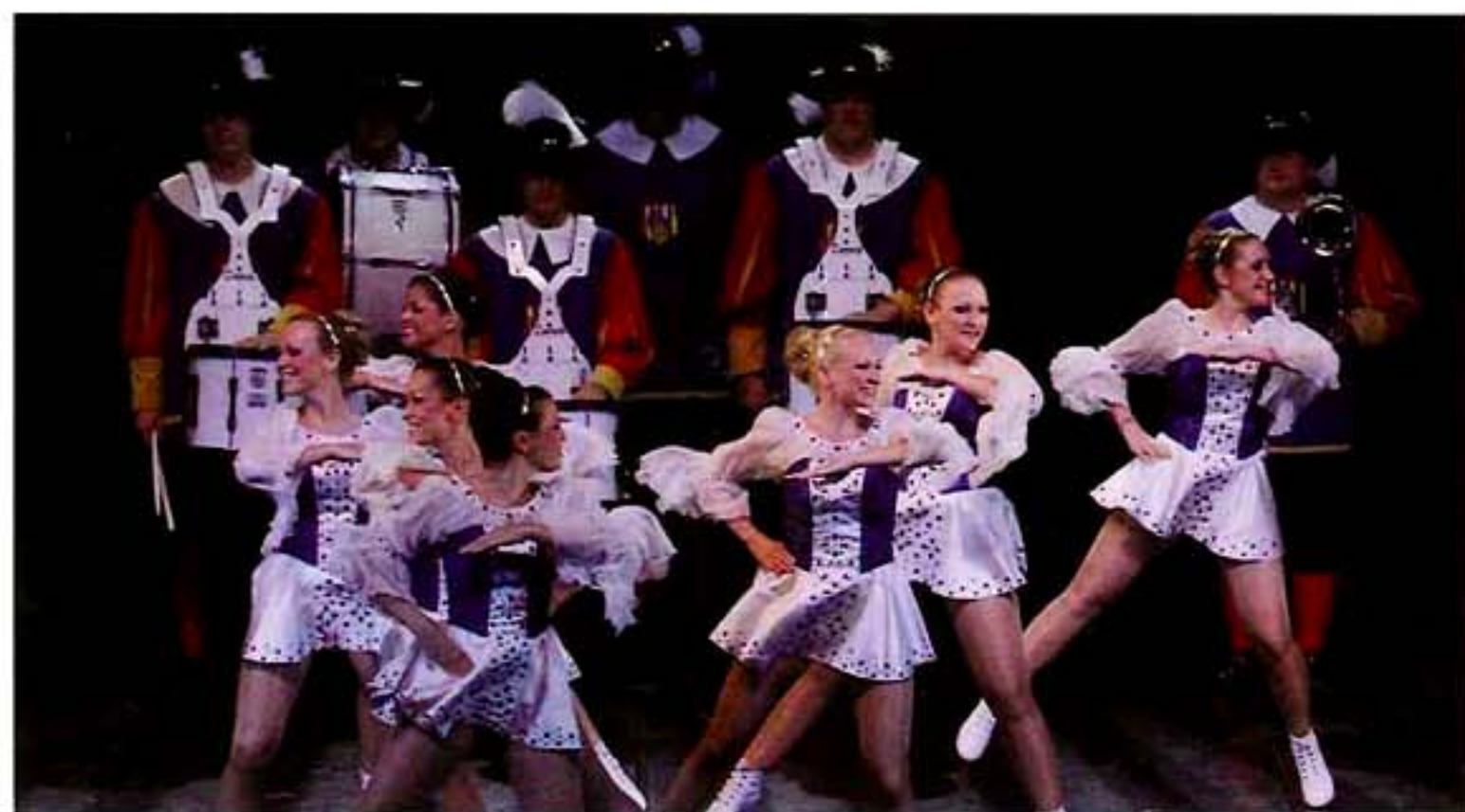
親衛隊の舞と ファンファーレ行進楽隊 (ドイツハーナウ市)