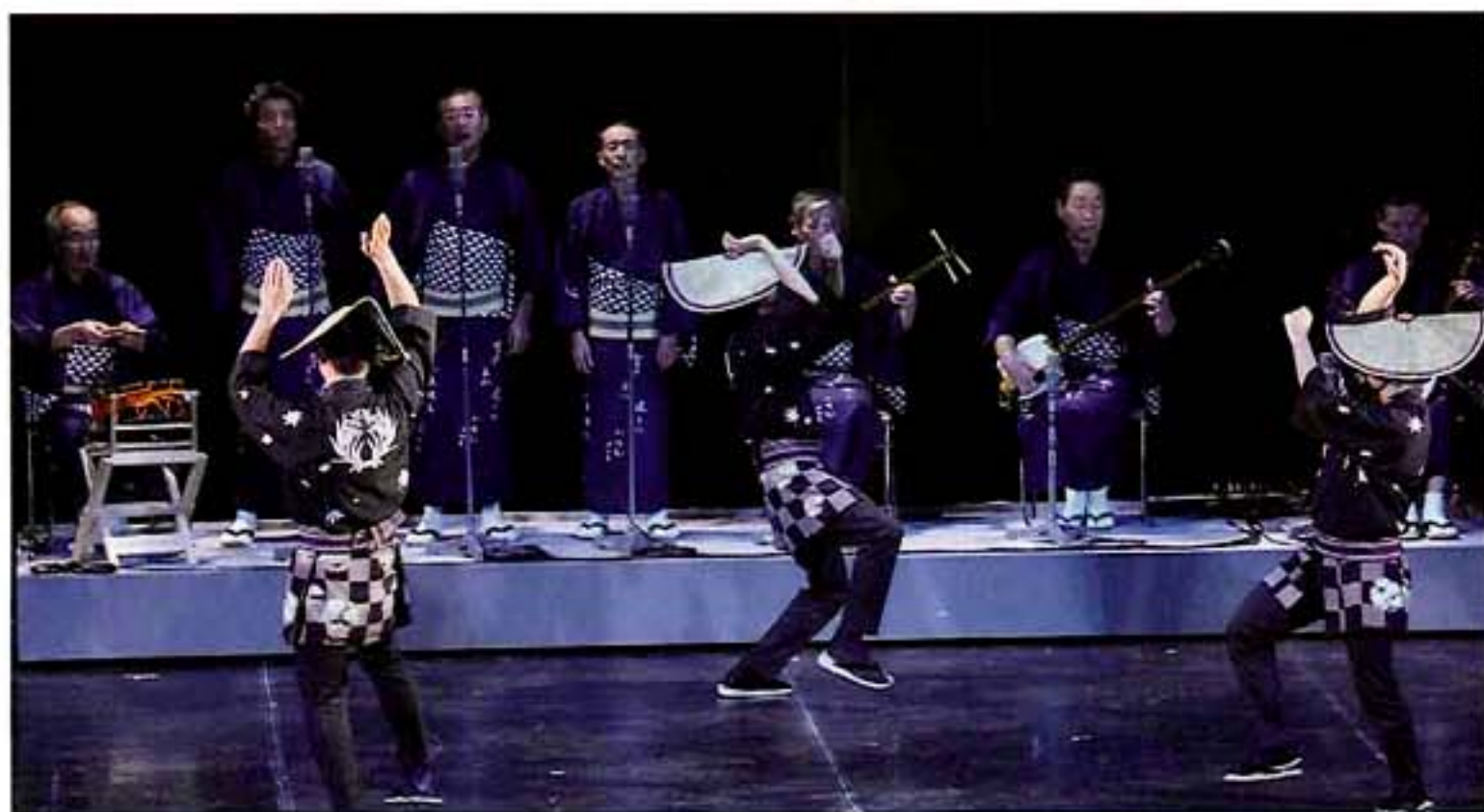
越中八尾おわら風の盆 (富山県富山市)