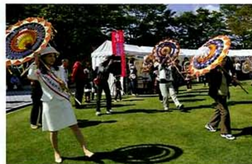
鳥取しゃんしゃん傘踊り