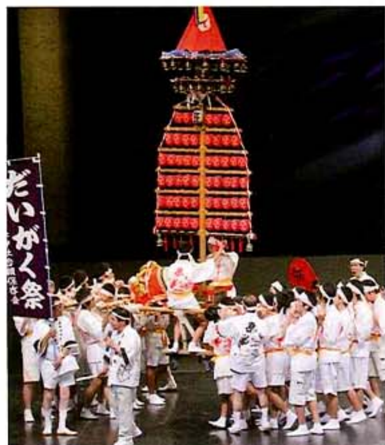
玉出のだいがく (大阪府大阪市)