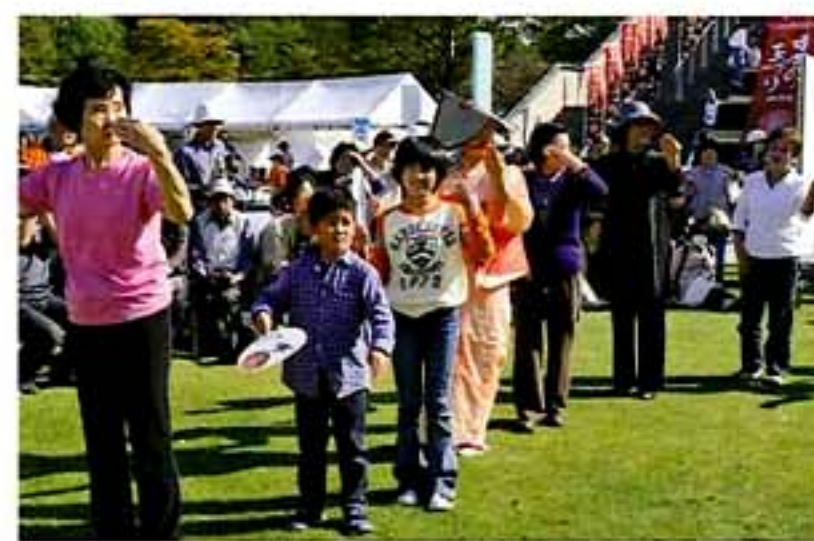
越中八尾おわら風の盆