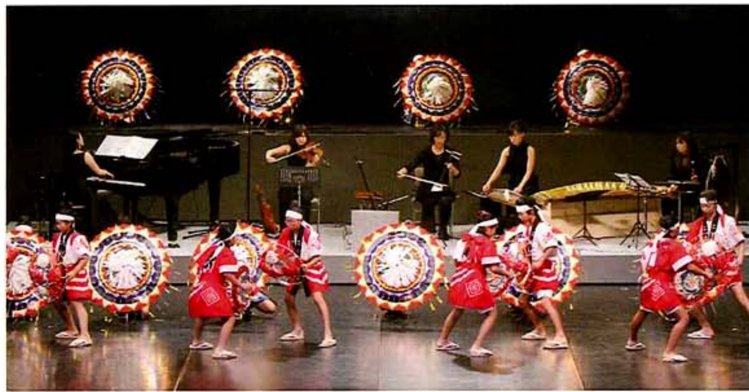
【創作郷土芸能】 浦富八景 夏の章 (鳥取県鳥取市)