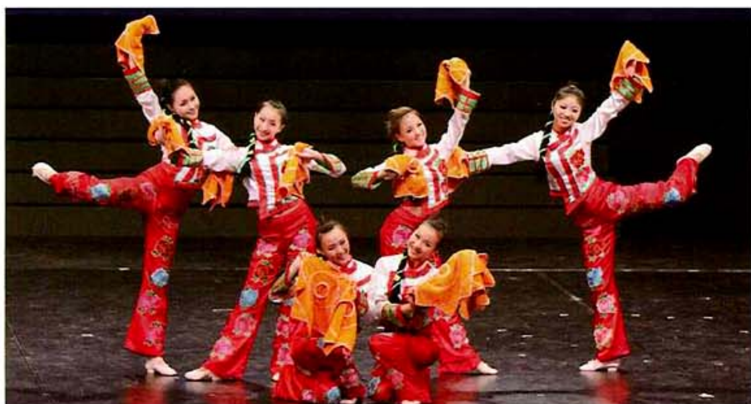
【熱愛・憧れ】中国の伝統舞踊 (中国吉林省) と音楽