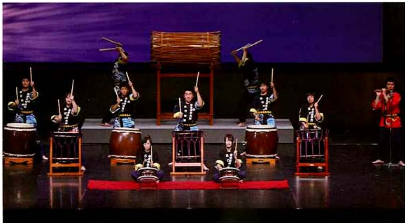
倉農太鼓 (鳥取県倉吉市)