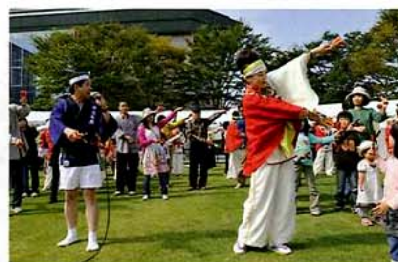
よさこい鳴子踊り