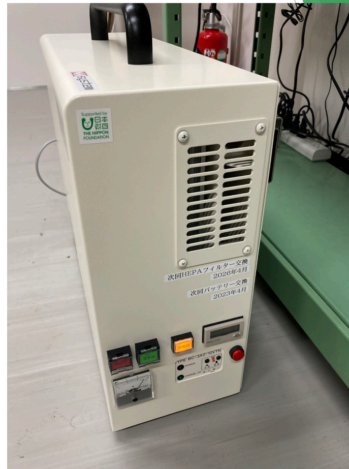
事業番号17：陰圧キャリングベッド（COVID-19患者搬送用）の導入