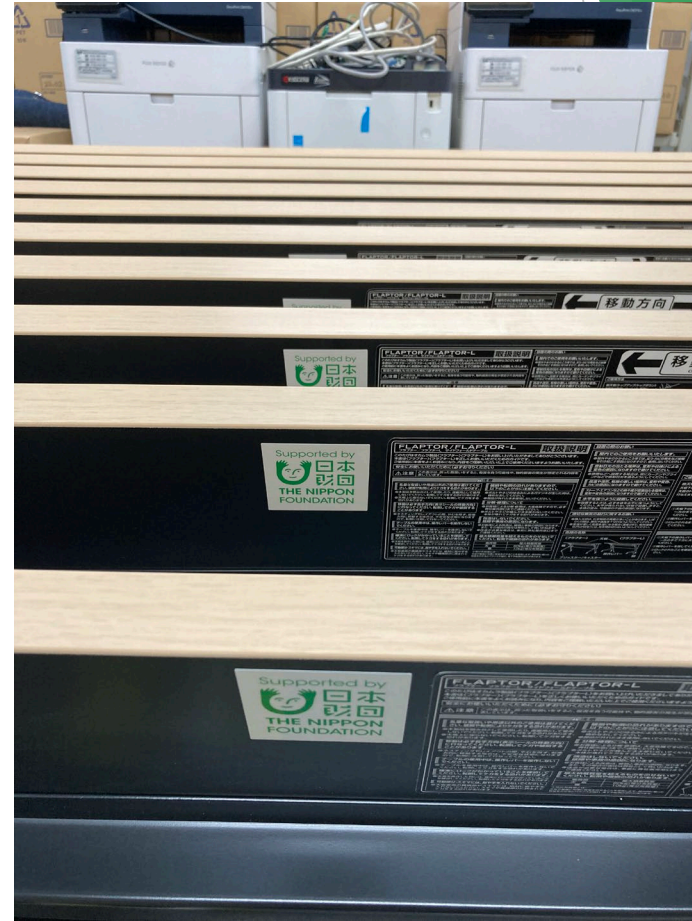
事業番号9：災害用備品（テーブル・椅子・ホワイトボード）の充実