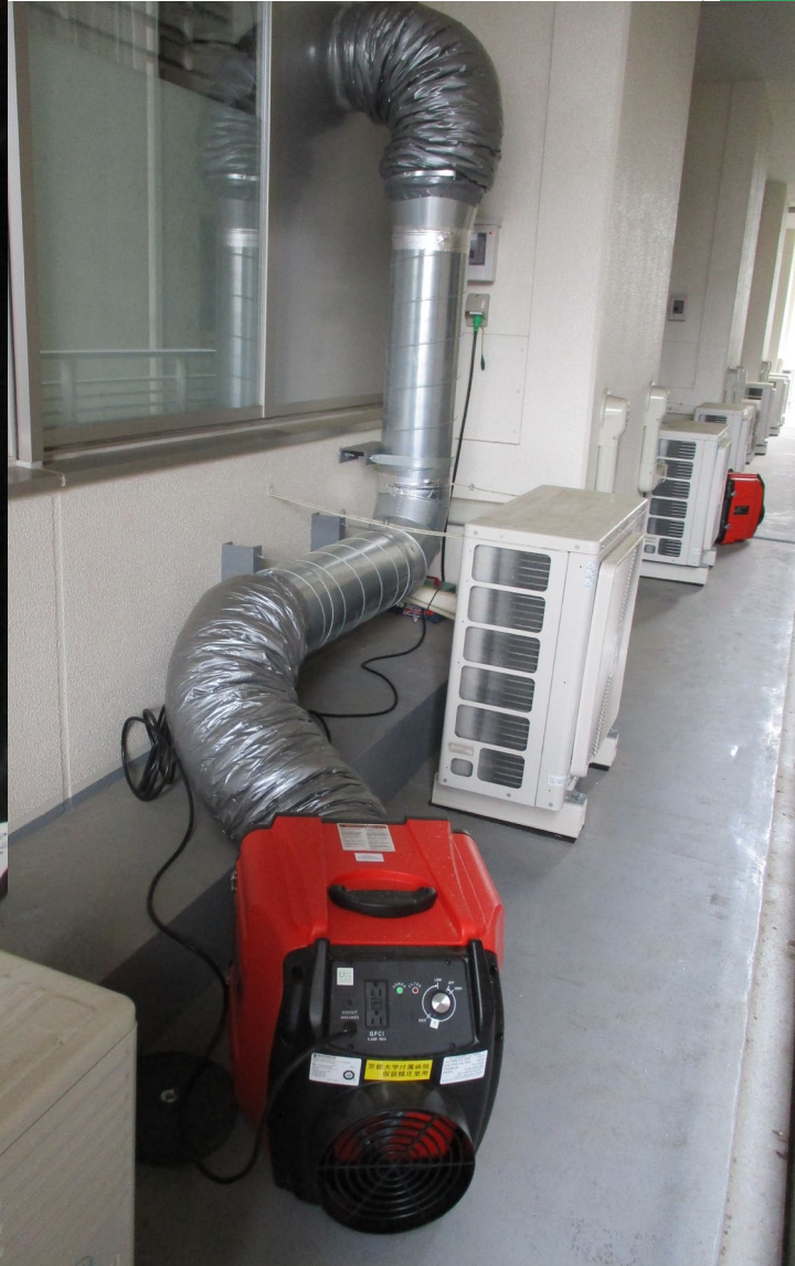
追加事業④：中病棟ICU陰圧室化工事