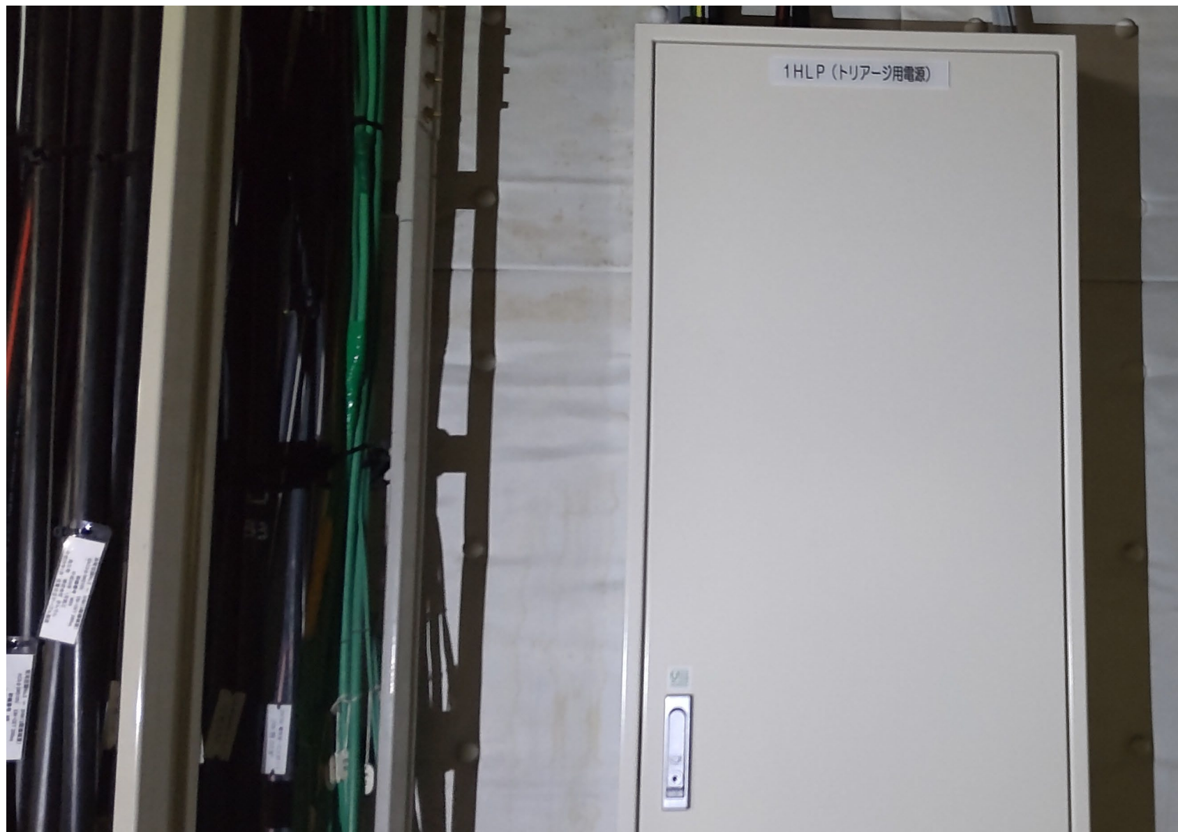
事業番号15：非常用電源工事（中央診療棟）