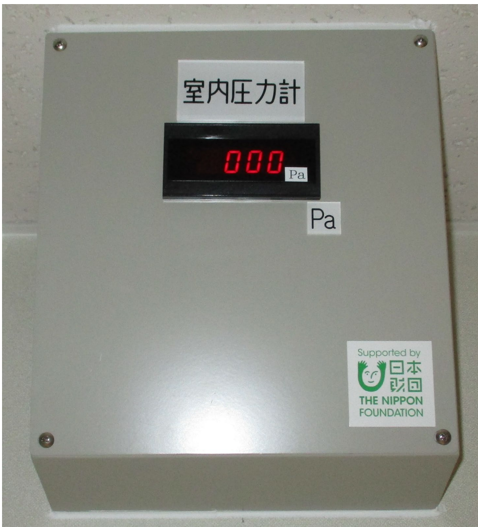
追加事業②：外来診療棟内視鏡室陰圧化工事