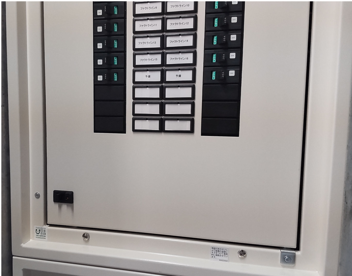
事業番号14：非常用電源工事（外来診療棟）