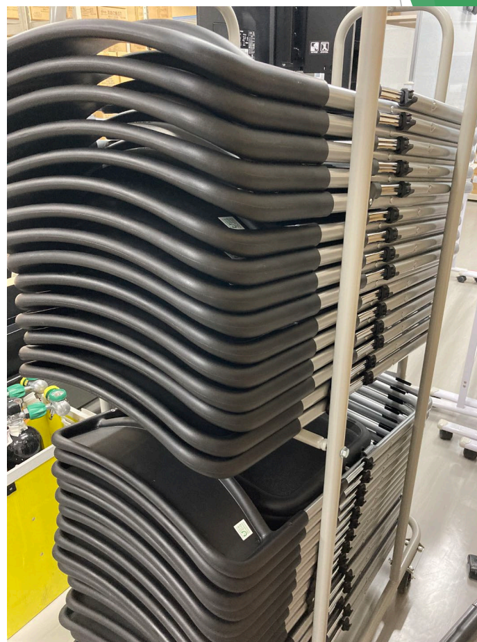
事業番号9：災害用備品（テーブル・椅子・ホワイトボード）の充実