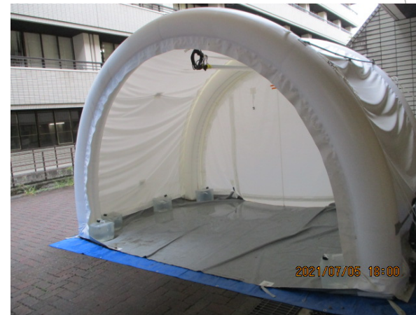
事業番号16：医療用陰圧エアテントの導入