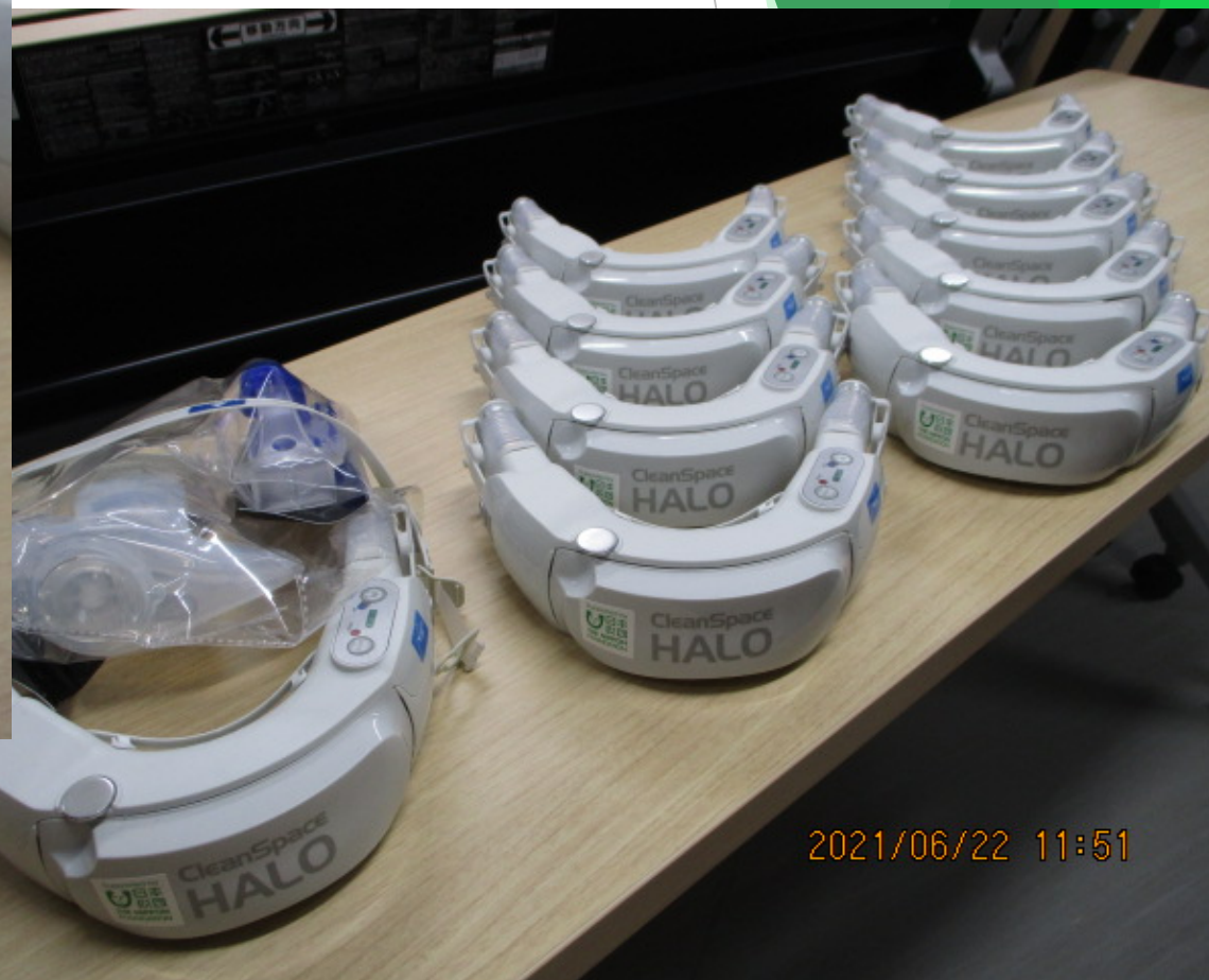
事業番号18：電動ファン付呼吸用保護具の導入