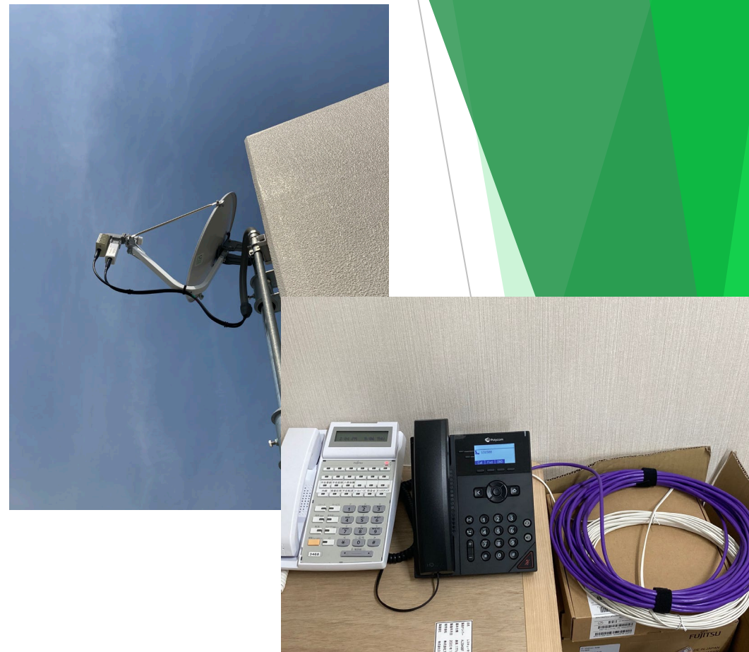
事業番号 3 : 災害対策本部にて使用する衛星電話設備環境の構築