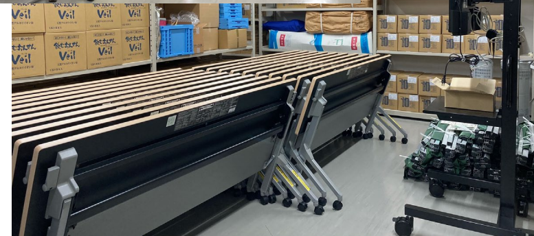
事業番号10：災害用備蓄倉庫の整備（中量棚解体・移設、備蓄物資移設作業）