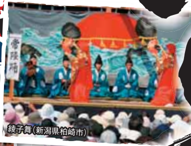
綾子舞(新潟県柏崎市)