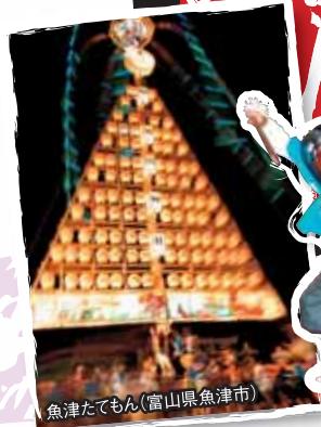
魚津たてもん(富山県魚津市)