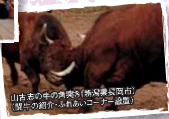
山古志の牛の角突き(新潟県長岡市) (闘牛の紹介・ふれあいコーナー設置)