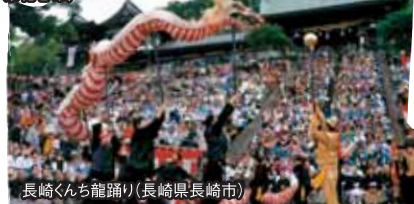
長崎くんち龍踊り(長崎県長崎市)