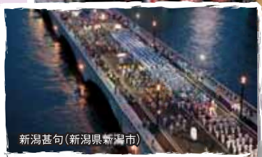
新潟甚句(新潟県新潟市)