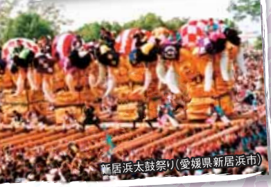
新居浜太鼓祭り(愛媛県新居浜市)