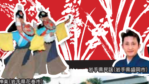
早池峰神楽(岩手県花巻市)