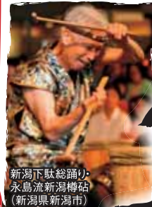
新潟下駄総踊り 永島流新潟樽站 (新潟県新潟市)