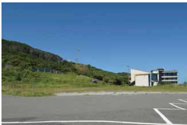
■ブルーコーナー位置