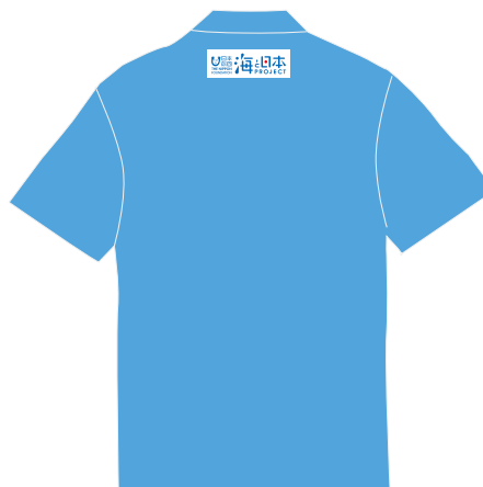
ロゴ: H3cm×W約8cm ※印刷最大範囲: H20cm×W10cm