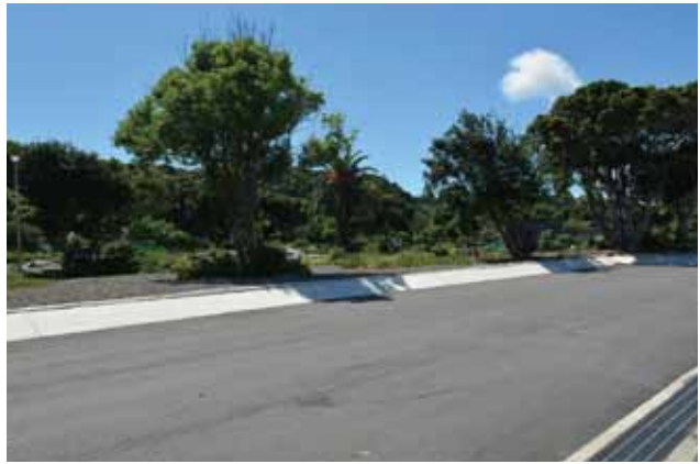
■ エコパーク駐車場位置