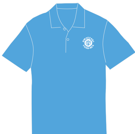
ロゴ: H6.2cm×W6cm ※印刷最大範囲: H10cm×W10cm