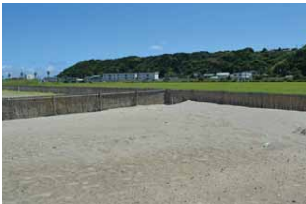
■着替えテント位置