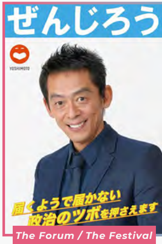
The Forum / The Festival