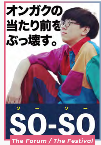
The Forum / The Festival